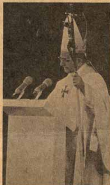
S. S. PAULO VI

"Dando al olvido lo que ya queda atrás, me lanzo en persecución de lo que tengo delante; corro hacia la meta, hacia el galardón de la Soberana vocación de Dios en Cristo Jesús".