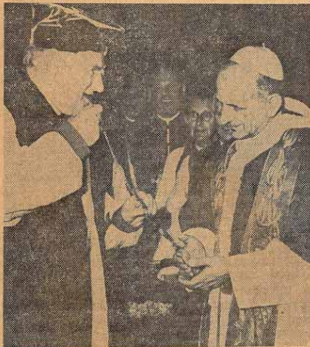
Monseñor Ramsey obsequia a Paulo VI con una Cruz pectoral.