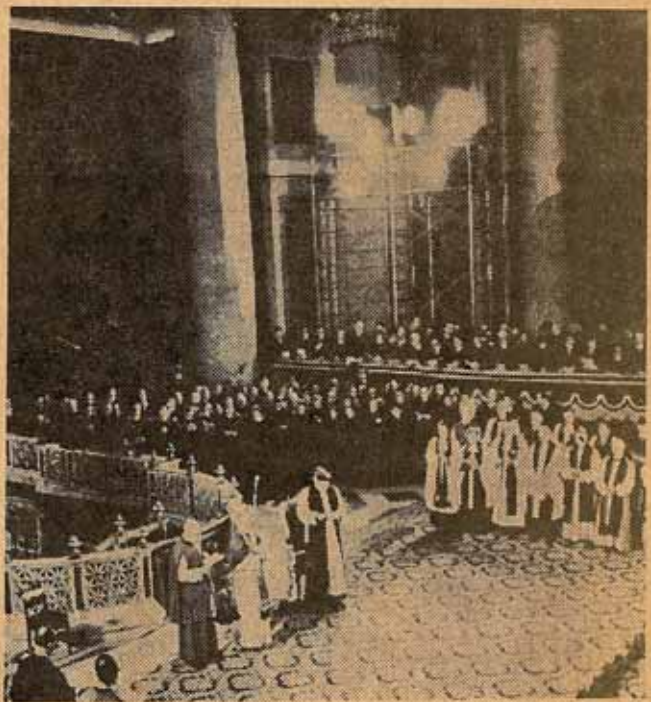
Durante el oficio celebrado en la Basílica de San Pedro.