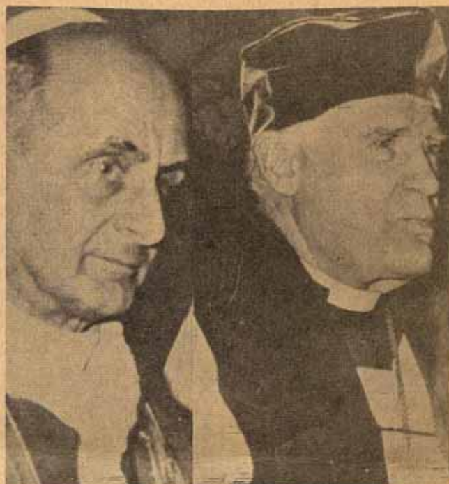
Marzo 1965: Paulo VI y el Arzobispo Ramsey, Primado Anglicano.