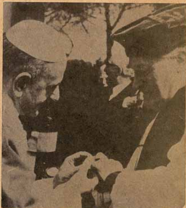
El Papa coloca al Primado Anglicano el anillo con que le obsequió.