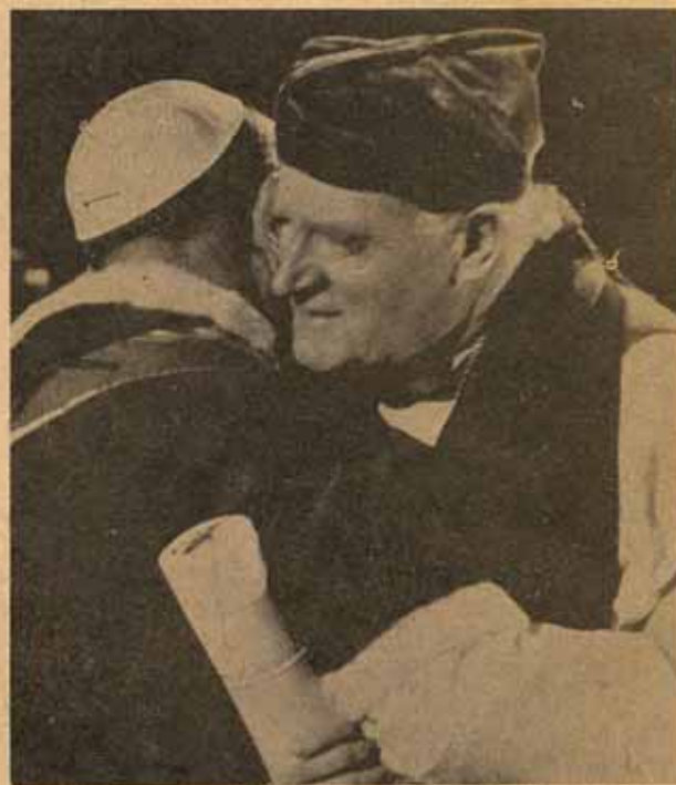
Abrazo de Paulo VI y el Arzobispo Ramsey, en su Histórica entrevista.