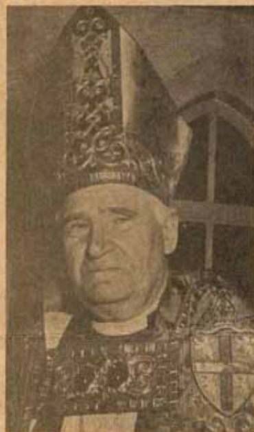
S. E. R. ARTHUR RAMSEY

Gregorio "En Roma, ciudad de la que salió hacia Inglaterra San Agustín, fundador de la Sede de Canterbury, enviado por el Papa San Agustín el Grande, y cuya Sede es considerada hoy por todos los anglicanos como centro de su comunidad cristiana, Su Santidad el Papa Paulo VI y Su Gracia Michael Ramsey, Arzobispo de Canterbury, se encuentran para intercambiarse un fraternal saludo. Al final de su encuentro elevan gracias a Dios Todopoderoso que ha creado, por