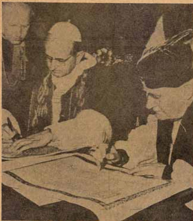
Paulo VI y el Arzobispo Ramsey firmando la Declaración conjunta