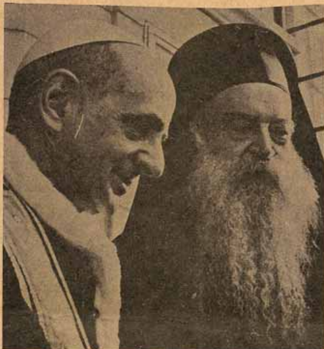
Enero 1964: Paulo VI y el Patriarca Ortodoxo Atenágoras.

nifestado sobre nuestra revista, tanto episcopales como romanos, en el sentido de que CREDO es la única publicación en Puerto Rico que se ocupa continuamente de temas ecuménicos. Ahora, creemos, que con mayor motivo debemos proseguir en esa línea ecuménica.