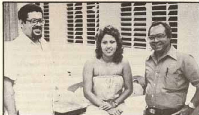
Secuencia fotográfica de sacerdotes y delegados de las parroquias a la Asamblea Constituyente de la Iglesia Episcopal Puertorriqueña, celebrada el día 5 de marzo de 1982 en Saint Just, P.R.