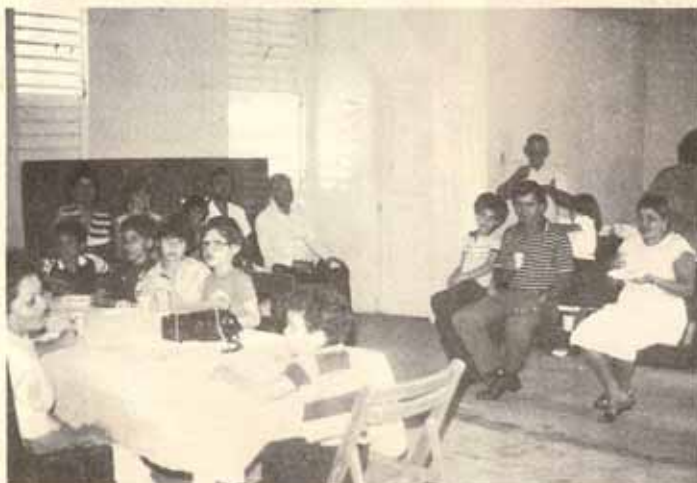
Feligreses Iglesias Santa Cruz y San Bartolomé Castañer, Puerto Rico.