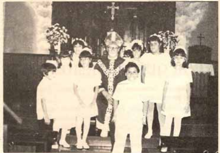
Visita Pastoral y Confirmación Iglesia San Andrés, Mayagüez, Puerto Rico.