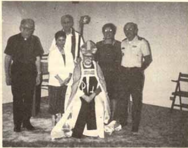
Visita Pastoral, Iglesia San Esteban, Guaynabo, Puerto Rico.