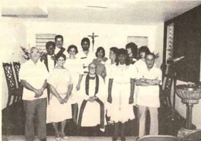
Visita Pastoral, Iglesia Santa María Magdalena, Levittown, Puerto Rico.