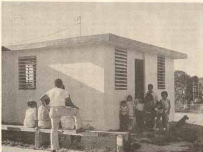
Capilla Emmanuel, Bo. Maguayo, Dorado, Puerto Rico.