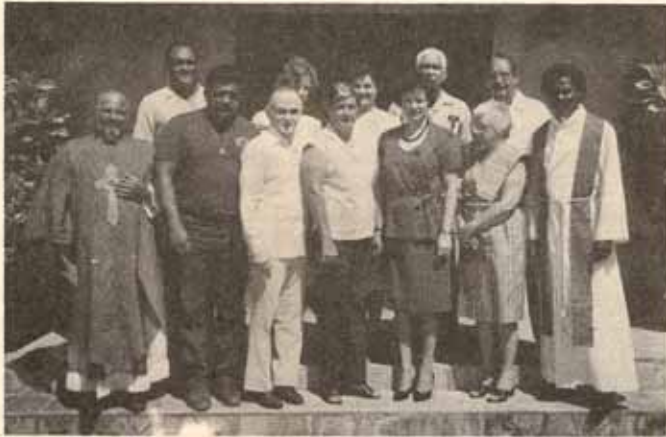
La Junta Pafroquial, Iglesia Buen Pastor, Fajardo, P.R.