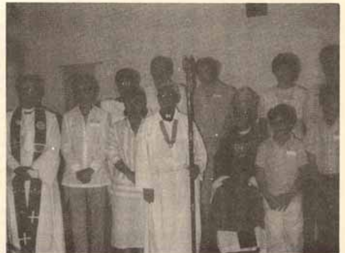
Visita pastoral, Iglesia Santa Hilda, Trujillo Alto, P.R.