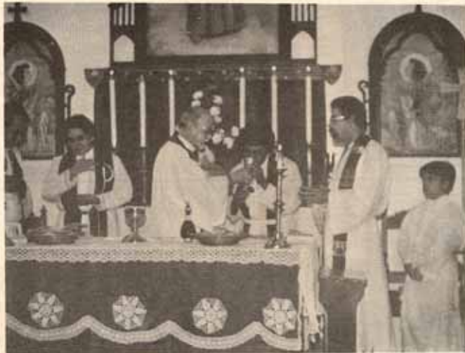
Febrero 28, 1986, Comunión y Instalación Rector.

Por el ministerio y excelente trabajo de la mujer en nuestro pueblo puertorriqueño, damos gracias a Dios.