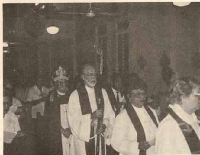
Procesión y Instalación Rector, SMU Febrero 28, 1986.