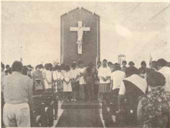
Retiro de jóvenes, Iglesia La Resurrección, Manatí, P.R.