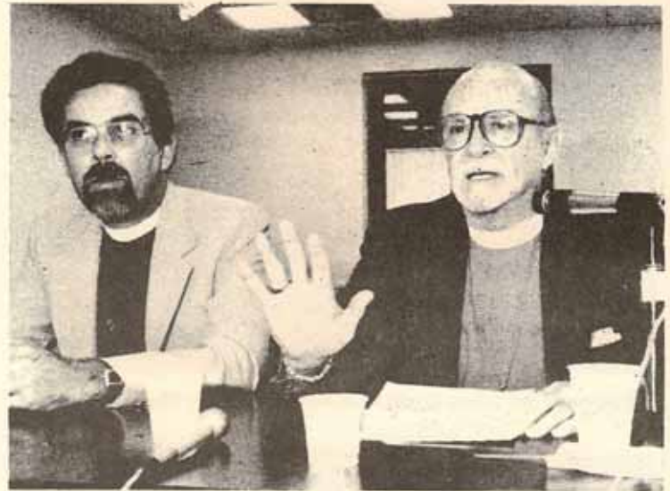
Apoya al proyecto: El obispo Francisco Reus Froilán apoyó un proyecto del Senado encaminado a establecer cursos sobre principios morales y éticos en las escuelas públicas del país. El religioso hizo los señalamientos en vistas públicas de la Comisión de Instrucción presidida por la senadora Gladys Rosario.

Cuando esto ocurre, la Biblia ha cumplido su función principal.