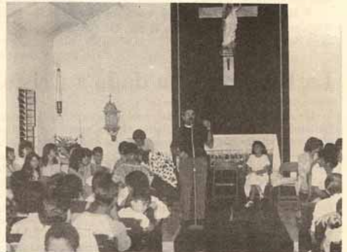
Clausura Cursillo de jóvenes Iglesia La Resurrección, Manatí, Puerto Rico.