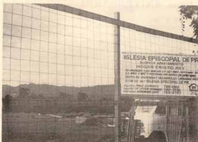
Inicio trabajos de edificio envejecientes en Caguas, P.R.