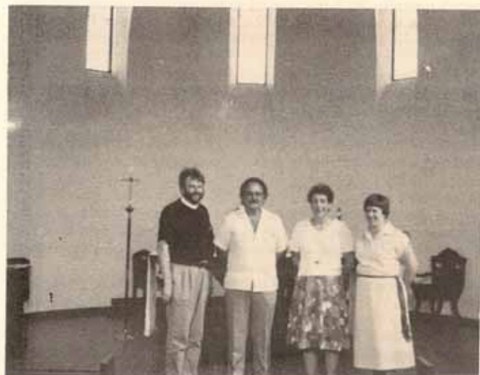
Visitantes de la Diócesis de Belén en Pennsylvania en la Iglesia Santísima Trinidad, Ponce, P.R.