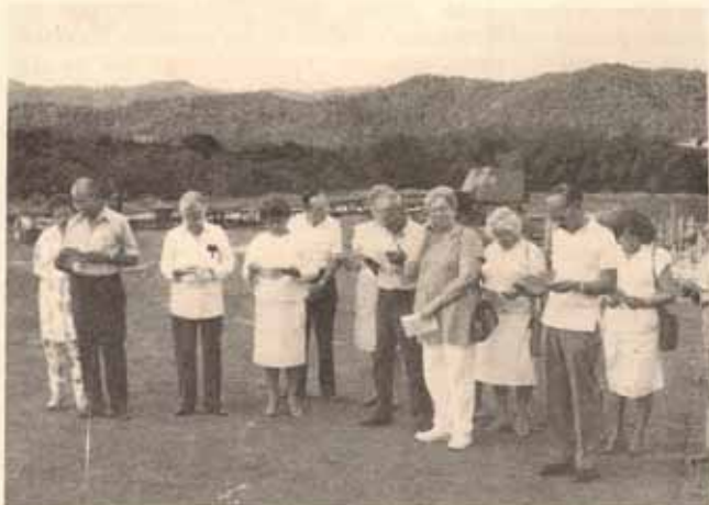
Feligreses Cristo Rey de Caguas en acto de bendición del terreno edificio de envejecientes.