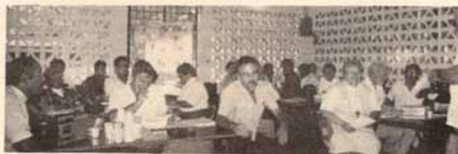
Retiro del clero diocesano en Semana Santa.