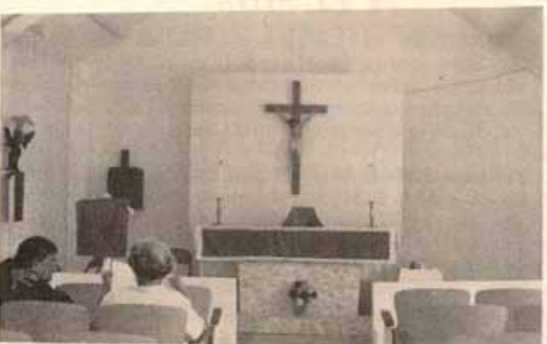
Interior Iglesia San Juan Apóstol de Bo. Barina de Yauco, P.R.