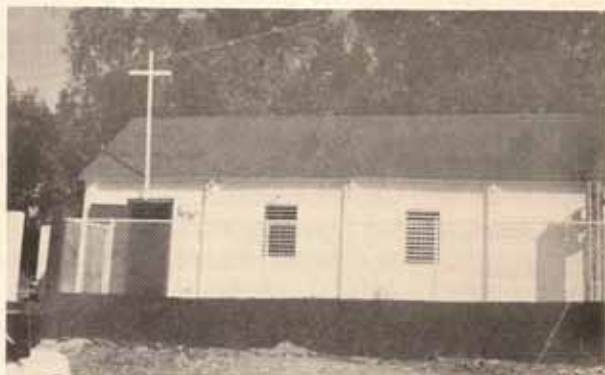
Renovación de exterior Iglesia San Juan Apóstol, Bo. Barina, Yauco, P.R.