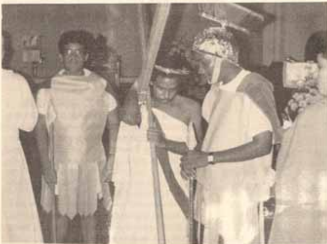
Via Crucis en vivo realizado por los jóvenes en Santísima Trinidad, Ponce.