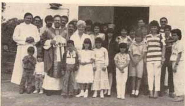
Visita pastoral Iglesia San Judas Tadeo Bo. Pastos, Aibonito, P.R.