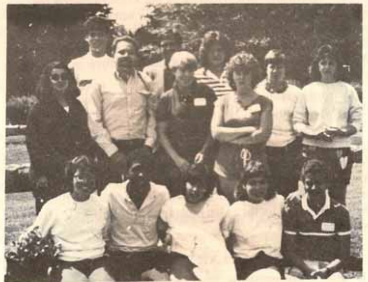
Intercambio de jóvenes Diócesis de Puerto Rico y la de Belén U.S.A.