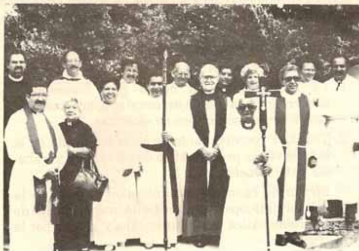
Final de curso del Programa Estudio del semestre de Pascua.