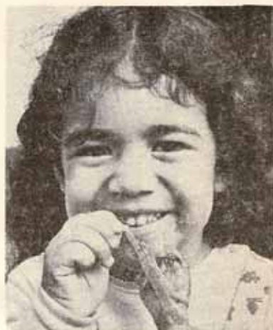
Niña comiendo papa