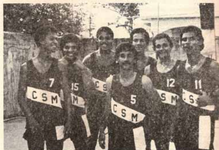
Equipo Campeón de la Casa San Miguel, Ponce.