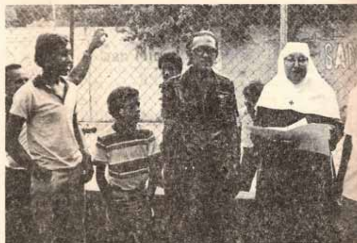
Padres e hijos recibiendo certificados durante la celebración del Aniversario de la Casa San Miguel, Ponce.