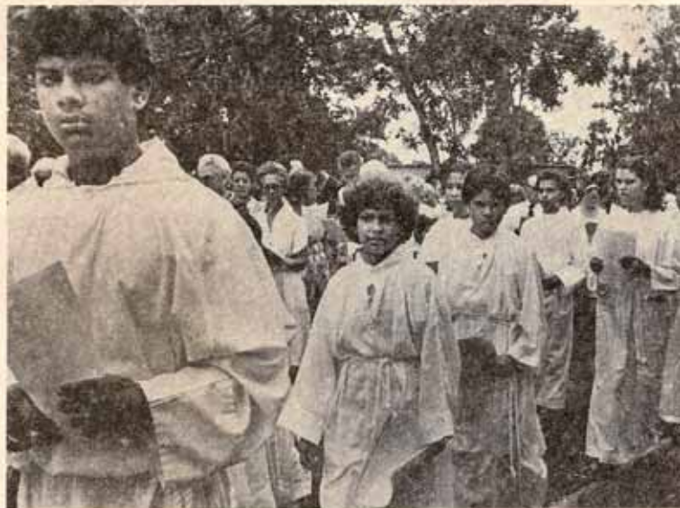
Monaguillos en Procesión.