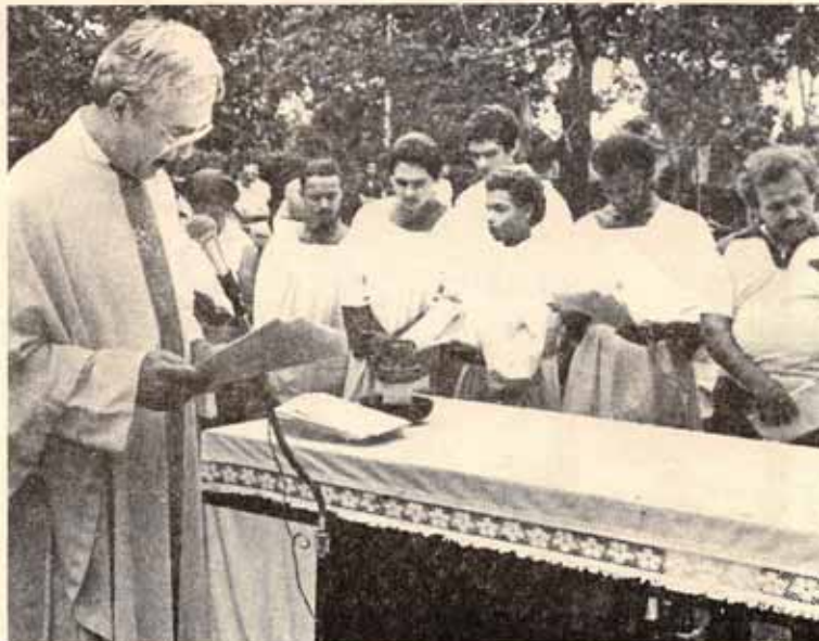
Reconocimiento a los Monaguillos.