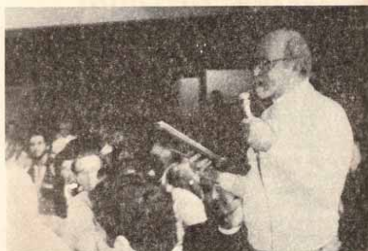
El Obispo Reus durante la Asamblea del Consejo Latinoamericano de Iglesias (CLAI) celebrada en Lima, Perú.