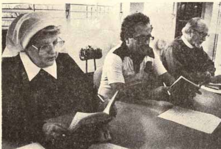
Asistentes a Taller sobre Música Litúrgica.