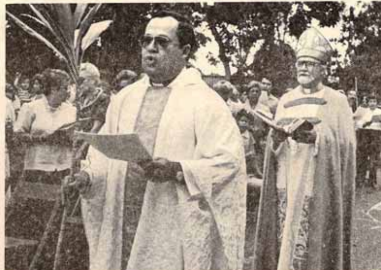
Obispo en Procesión.