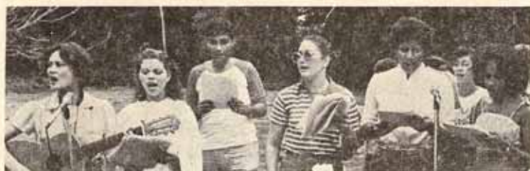
Grupo musical de Ponce