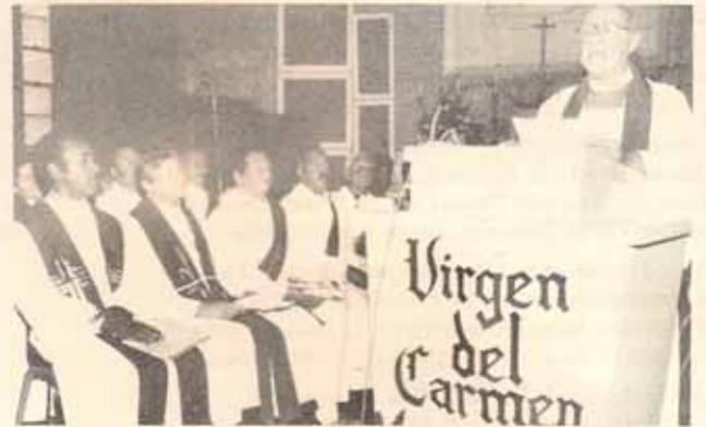
El Obispo F. Reus Froylán pronuncia el sermón en la consagración del Obispo David.