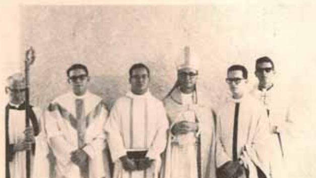
Ordenación al Sacerdocio en Cristo Rey, Caguas, P.R.