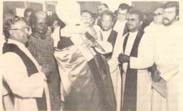
Momentos en que el nuevo Obispo consagrado es abrazado por sacerdotes y el pueblo.