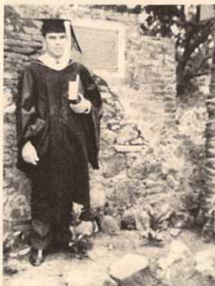
Graduación. Universidad Interamericana de San Germán.