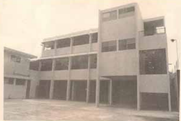
Nuevos salones de clases en el Colegio Episcopal San Andrés de Mayagüez, P.R.