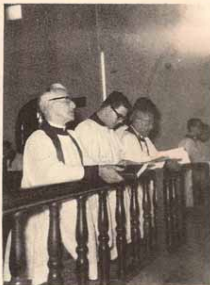
Ordenación al Diaconado.