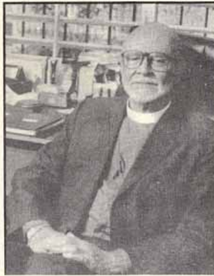
ILUSTRISIMO Y REVERENDISIMO OBISPO FRANCISCO REUS FROYLAN

Su episcopado se caracterizó por darle más participación al laicado dentro y fuera de la Iglesia. Su mirada estaba fijada en formar un clero nacional puertorriqueño y en el autosostenimiento de las iglesias locales, por la razón de que la Iglesia puertorriqueña adquirió su autonomía de la Iglesia norteamericana.