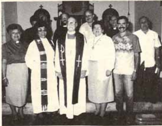
Sacerdotes con el Obispo Reus.

CELEBRACION DEL 65 ANIVERSARIO DE LA IGLESIA SANTA MARIA VIRGEN DE PONCE.