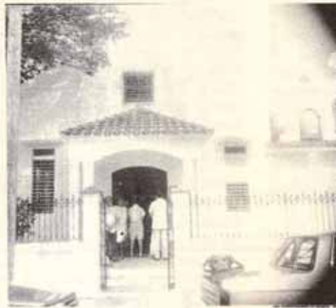
Templo Santa María Virgen.