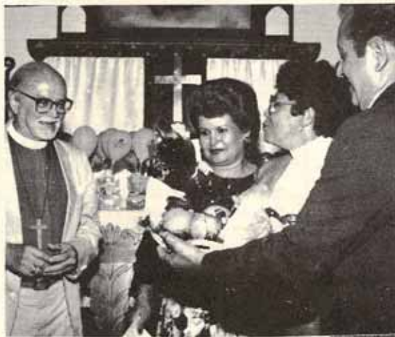
Homenaje al Obispo Reus en Sta. María Virgen.