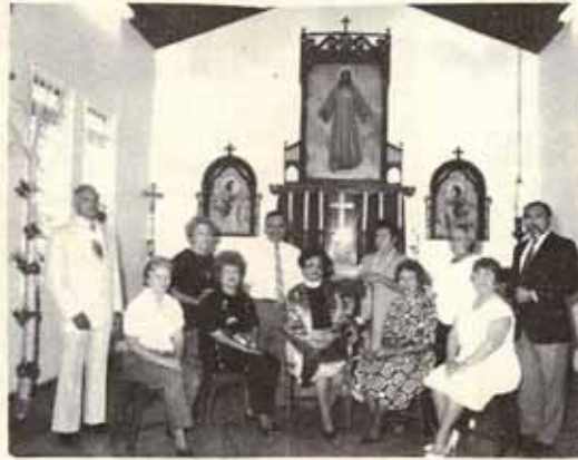
Junta Parroquial de Santa María Virgen.