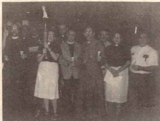
Miembros del Clero entonando un cántico

No queremos cerrar esta edición de CREDO sin agradecer a GENESIS su ayuda y participación en la Vigilia de Oración en Ponce. GENESIS agrupa a los jóvenes de la Iglesia Episcopal Puertorriqueña. Es una de las más dinámicas organizaciones nuestras.