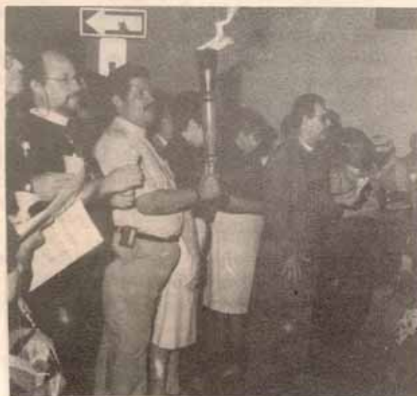
Momento de Oracion por la Paz