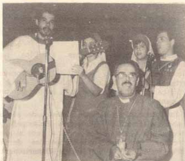
Los monjes y monjas de la Orden de San Juan Bautista con el Obispo Alvarez en una alabanza.