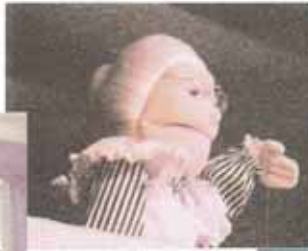
La abuela de Episco-Puppets, Parroquia San Andrés, Mayagüez

Unos niños entraban y otros salían de la casa de brincos. Unos escalaron la montaña con éxito.