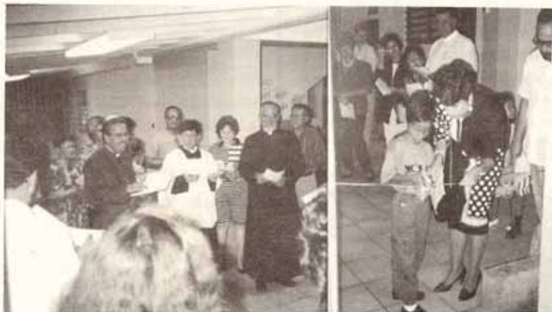
Centro de Educación Especial La Encarnación

Nuestra felicitación al Coro y les exhortamos a continuar su ministerio y motivar a otras áreas a organizarse.