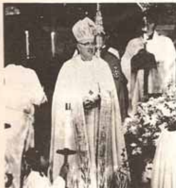
El Arzobispo de Cantóbery, George Carey, en la iglesia del Redentor de Baltimore en la celebración de 3 siglos de presencia anglicana en Maryland.