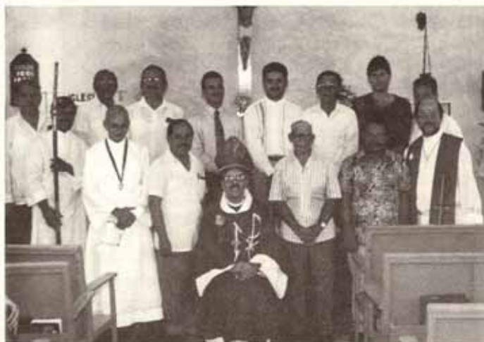
Asociación de Hombres Episcopales de la iglesia San Mateo, Peñuelas