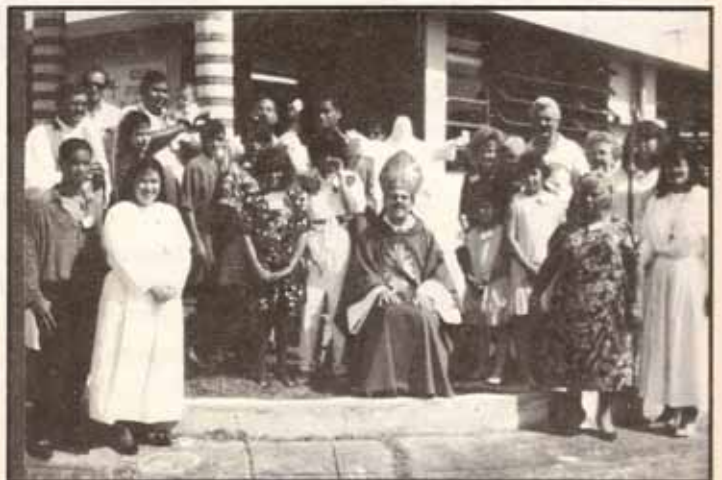
Bautismos, Confirmaciones y Recepciones durante Visita Pastoral a la iglesia El Adviento, Carolina