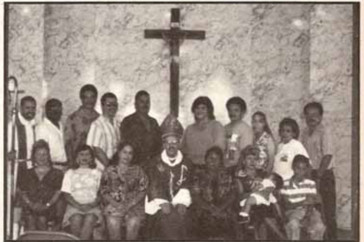
Visita Pastoral a la iglesia San Miguel Arcángel, Ponce