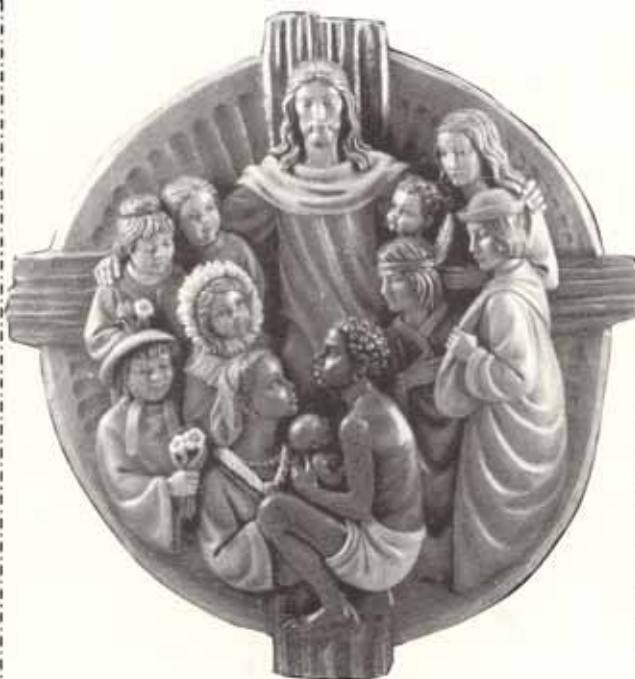
imagen del Cristo de todas las naciones

Los temas litúrgico-espirituales de la epifanía son, por tanto, los mismos de la navidad: la contemplación, la gloria, el don, pero entendidas en un sentido más amplio y más profundo al mismo tiempo; el misterio de la encarnación se expande y se dilata en el misterio del cuerpo místico, que