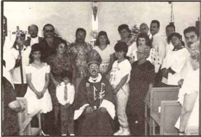
Visita Pastoral a la igl. San Mateo apóstol, Peñuelas