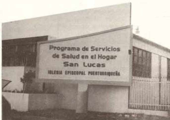
Nuevas facilidades del Programa de Salud en el Hogar San Lucas ubicadas en Ponce