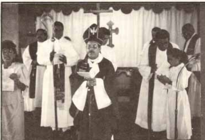
Momento en la liturgia para la Bendición y Dedicación de la iglesia San Matías, Lares