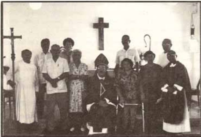
Confirmaciones y Recepciones durante Visita Pastoral a la igl. Santa Cecilia, Ensenada