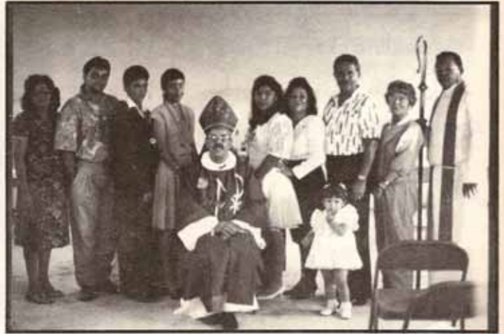
Visita Pastoral a la igl. San Judas Tadeo, Aibonito