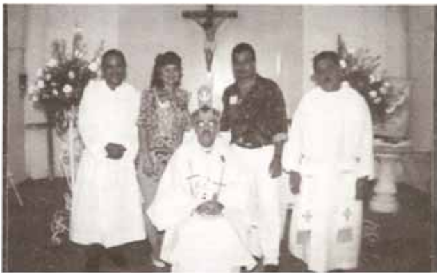
Recepciones en visita pastoral a la Iglesia San Juan apóstol y Evangelista en Yauco.