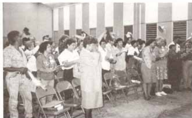
Vista Parcial de Asistentes del I Encuentro de Cursillistas de nuestra Diócesis