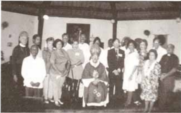
Recepción y Confirmación de miembros de la Iglesia San Francisco de Asís en Río Piedras.