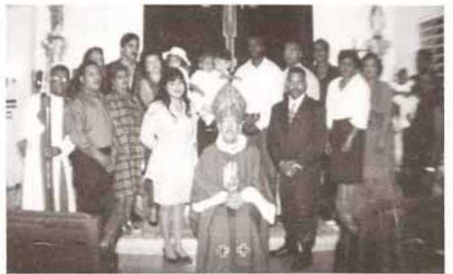
Bautismos celebrados en Visita a la Iglesia San José, Río Piedras