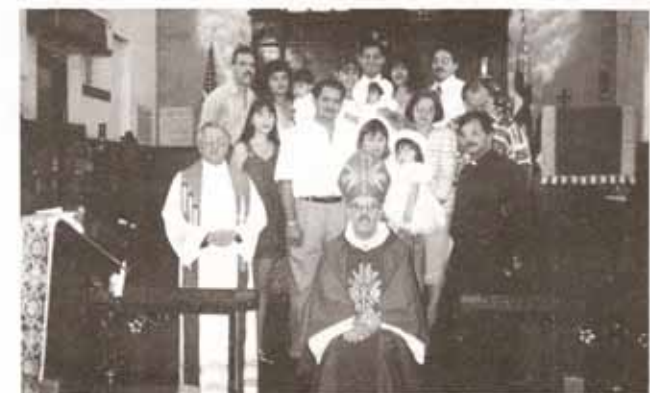
Bautismos, confirmaciones y recepciones en visita Pastoral a la parroquia San Andrés, Mayagüez.