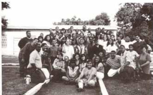
Grupo de Jóvenes participantes en Retiro de Adviento para la Juventud Episcopal