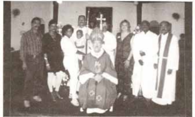
Bautismos en Visita Pastoral a la feligresía Santo Tomás Apóstol en Carolina.