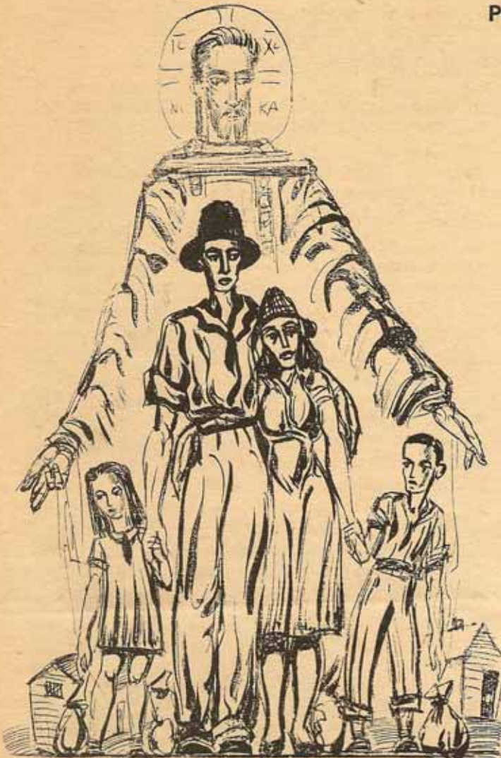
Dibujo de Allan R. Crite.

Afirmamos y apoyamos los programas de control poblacional, reconociendo y proclamando que la explosiva