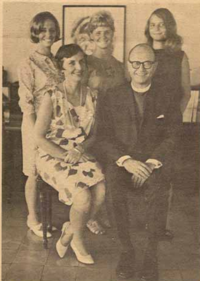
El señor Obispo Reus y familia desean las máximas bendiciones durante el Año 1967 a la familia diocesana y a todos los lectores de C R E D O.

Tenemos información de otros actos ecuménicos que se proyectan en la Perla del Sur a celebrarse durante los días del Octavario, de los cuales ofreceremos información en nuestra próxima edición.