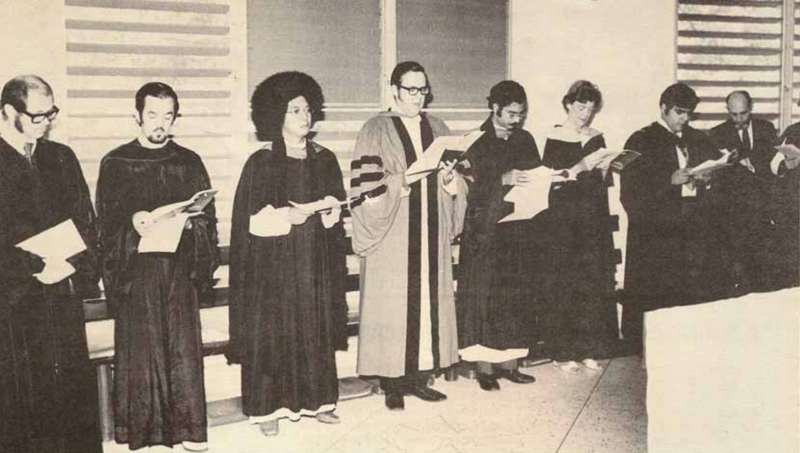
Parte de la Facultad del CENTRO CARIBEÑO DE ESTUDIOS POSTGRADUADOS en un servicio de colación de grados académicos.