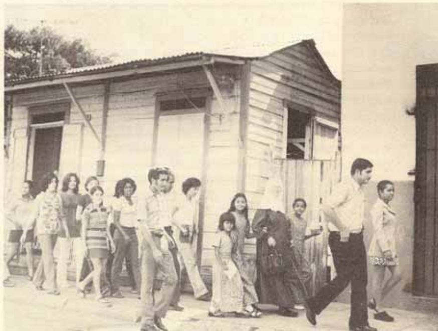
Grupo de hermanos camino de la capilla en el barrio Mameyes. Es atendida por la Iglesia San Miguel Arcangel.