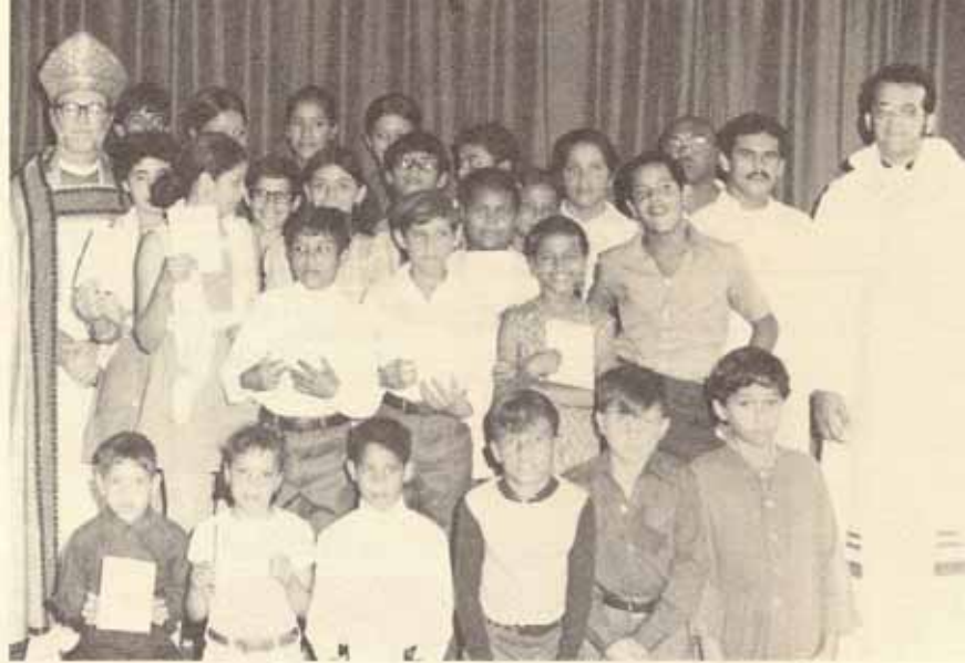
Grupo de confirmados por el Señor Obispo en su visita Pastoral a la iglesia San Miguel Arcangel en Ponce.