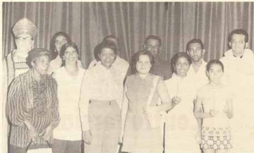
Grupo de personas recibidas en la Iglesia San Miguel. El mismo día de la visita Pastoral.