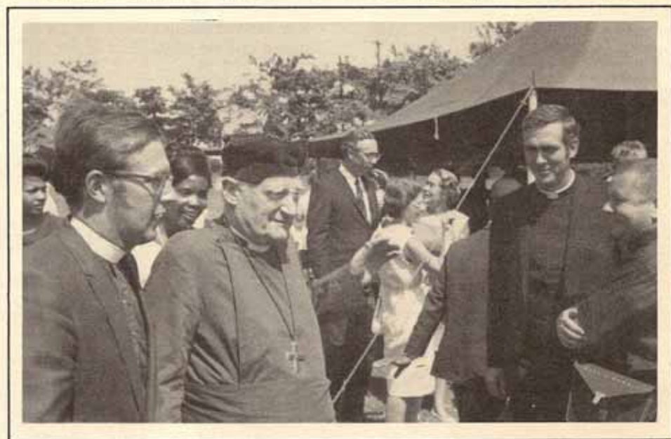
● Visita de Su Gracia Monseñor Arthur Michael Ramsey Arzobispo de Canterbury y Primado Anglicano al CENTRO CARIBEÑO DE ESTUDIOS POSTGRADUADOS.