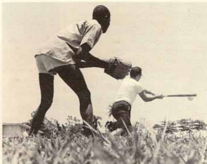
"Mens sana in corpore sano"; relajándose tras las árdas labores académicas diarias...