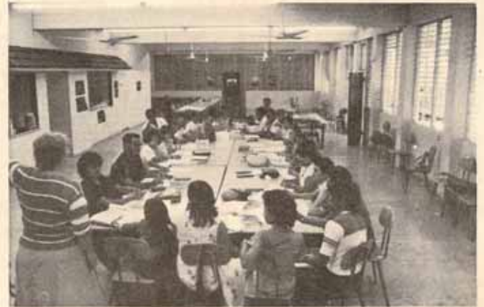
Vista general del Taller de Educación Cristiana en San Justo.