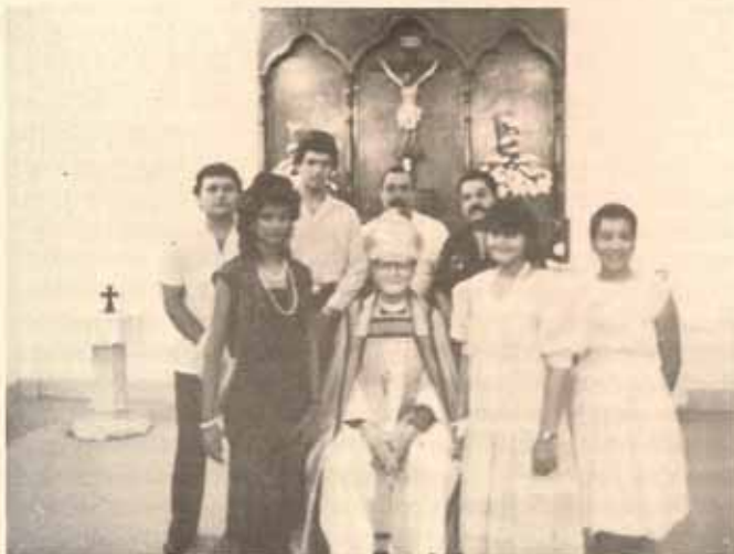
Visita Pastoral y Confirmación Iglesia San Rafael Yauco, Puerto Rico.