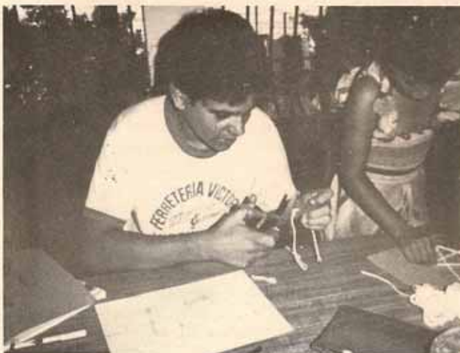
Dos jóvenes en el uso de la tijera en el Taller de Educación Cristiana celebrado en Vieques.