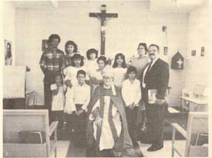
Visita Pastoral y Confirmación Iglesia San Mateo, Peñuelas, Puerto Rico.