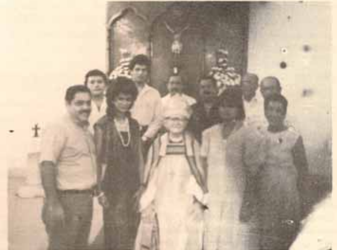
Visita Pastoral y Confirmación Iglesia San Rafael, Yauco, Puerto Rico.