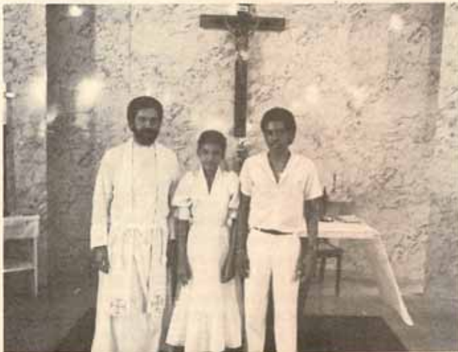
Recibidos en Visita Pastoral, Iglesia San Miguel, Ponce, Puerto Rico.