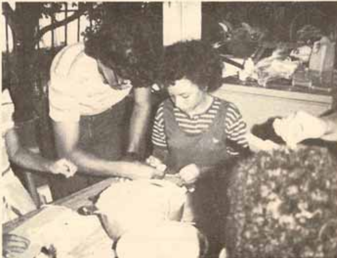
Maestra y niña en el Taller de Educación Cristiana en Vieques.