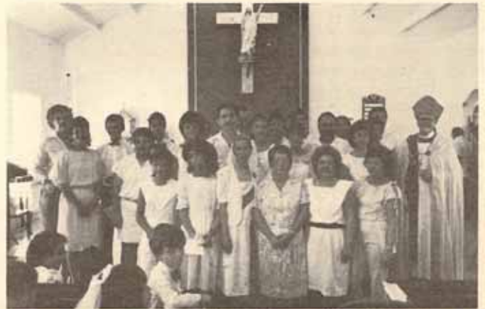
Visita Pastoral y Confirmación Iglesia La Resurrección, Manatí, Puerto Rico.