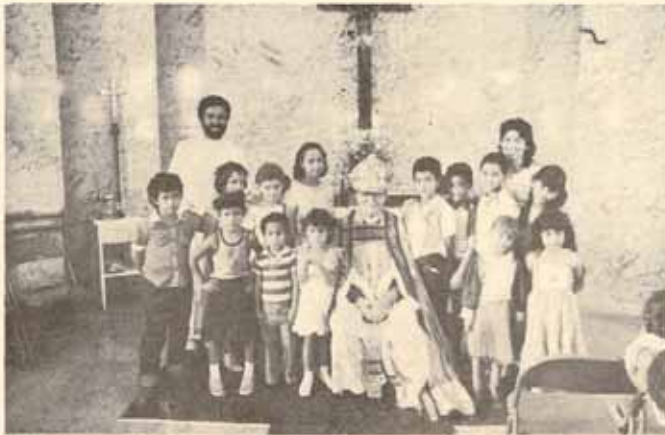
Clase de Confirmación, Iglesia San Miguel, Ponce, Puerto Rico.