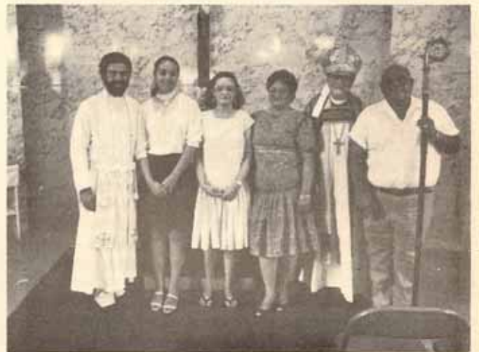
Visita Pastoral y Confirmación Iglesia San Miguel, Ponce, Puerto Rico.