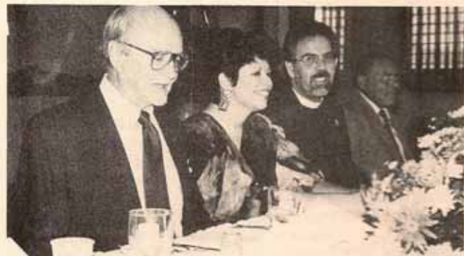
Celebración del vigésimo aniversario Programa Salud en el Hogar San Lucas de la Iglesia Episcopal.