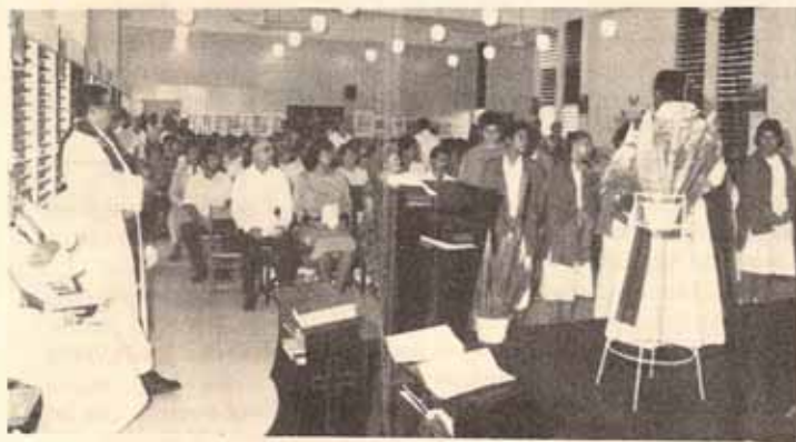
Congregación día aniversario de Cristo Rey Caguas, P.R.