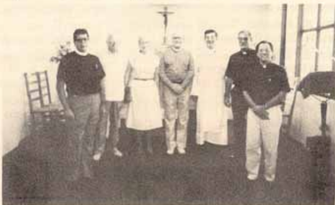
Visita pastoral, Iglesia Santa María Magdalena, Levittown, P.R.