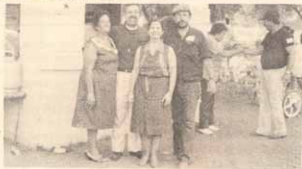
Celebración del Domingo Familiar Iglesia Santa Cecilia, Ensenada, P.R.