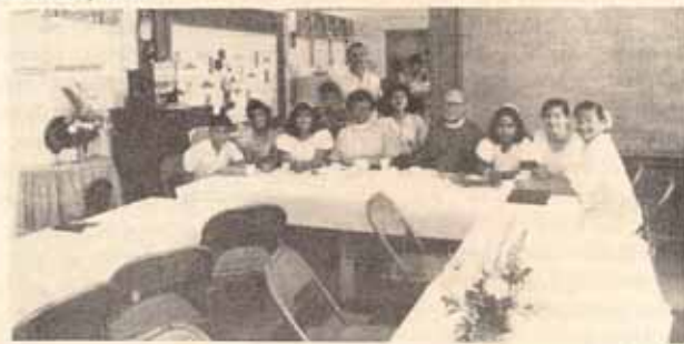
Visita pastoral, Iglesia Santa María Virgen, Ponce, P.R.