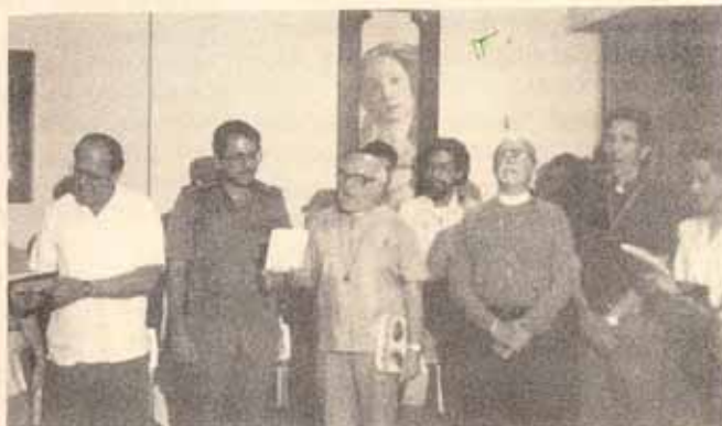
Obispo Reus en una pose Angelical con el Obispo Pagura y el presidente de Nicaragua.