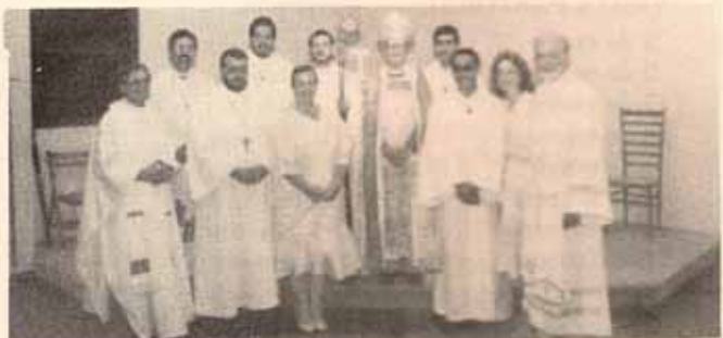
Recepción de monjes Hijos de María, Madre de la Providencia y otras personas en la Iglesia San Esteban de Parkville en Guaynabo, P.R.