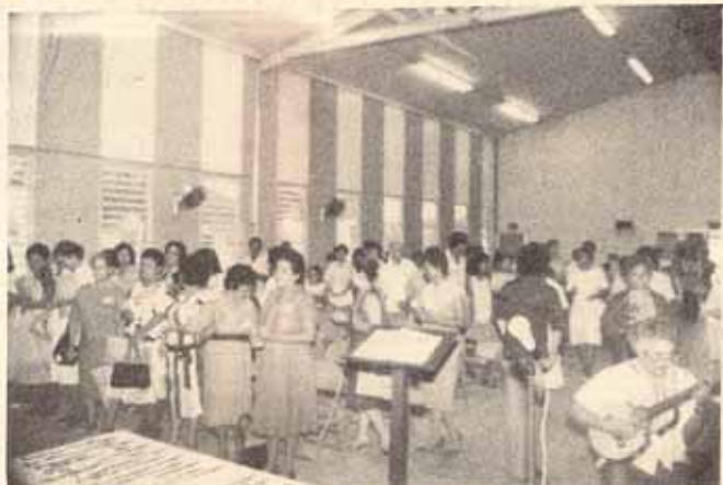
Ceremonia de clausura del cursillo para mujeres.