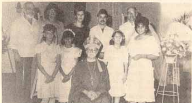
Confirmados y recibidos en Iglesia Cristo Rey Caguas, P.R.