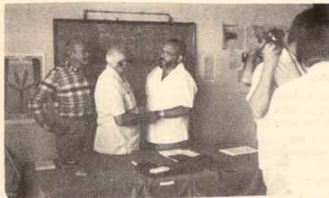
Obispo Reus, Pagura (metodista) y el Canciller de Nicaragua, el Padre D'Scotto.