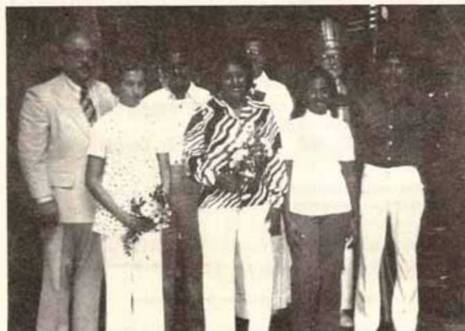
Clase Confirmación, Iglesia Santo Tomás