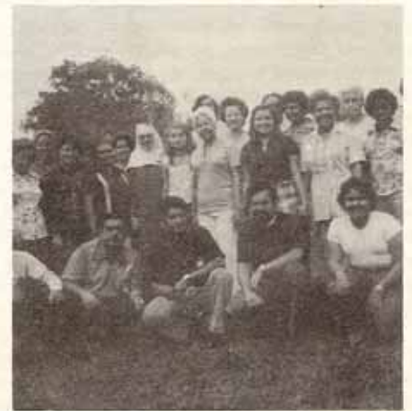
Conferencia de Laicos