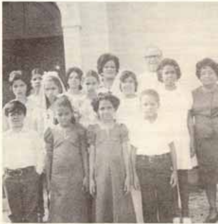
San José, Caimito, Río Piedras