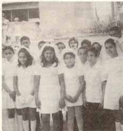
San Marcos, Magüeyes, Ponce