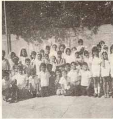
San Miguel, Ponce