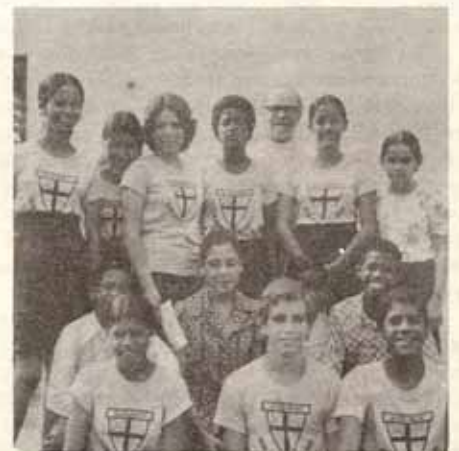
Conferencia de Jóvenes, San José, Caimito