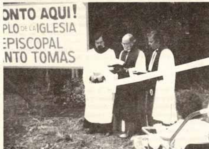
Bendición de Terreno. Primera fase de lo que será Santo Tomás.

A las 3:00 P.M. tuvimos la bendición del terreno donde irá ubicado nuestro edificio templo de Santo Tomás.