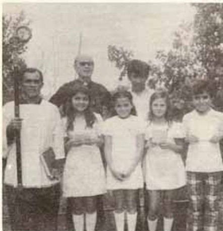
Las Transfiguración, Rubias, Yauco