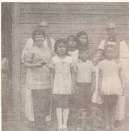
La Epifanía, Río Prieto, Lares