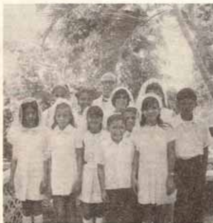
La Reconciliación, Quebrada Limón, Ponce