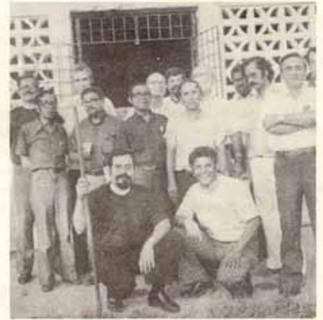
Conferencia del Clero