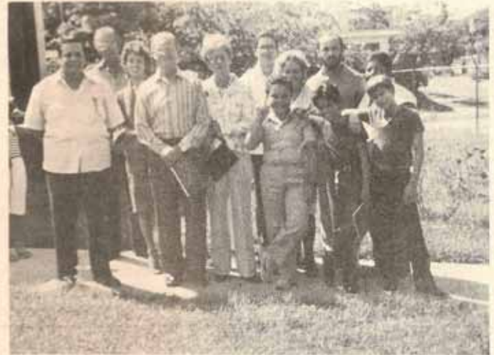
Feligreses Cristo Rey, Caguas, Puerto Rico.