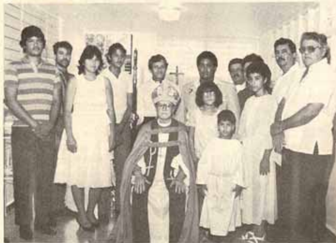
Confirmación y Recibidos Iglesia El Adviento.