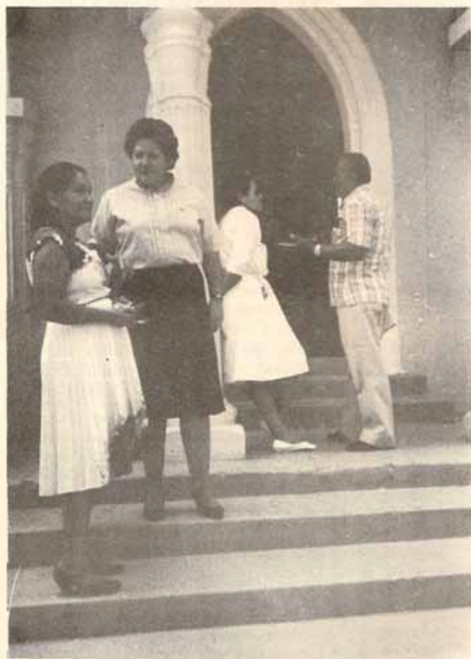
En Quebrada Limón, Ponce.