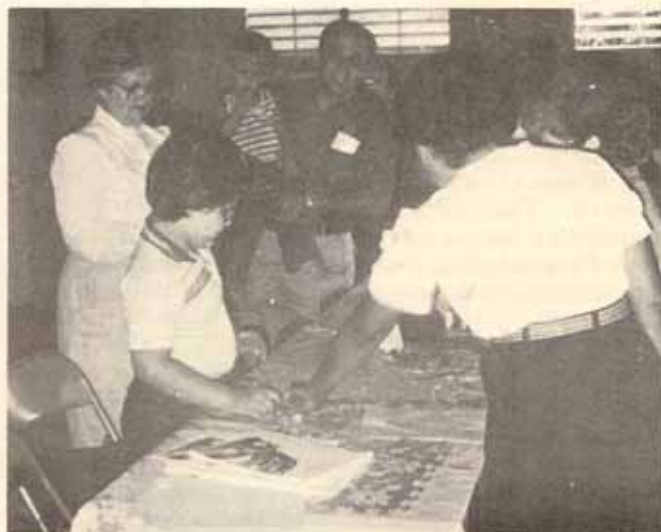
Iglesia San Bartolomé, Lares.