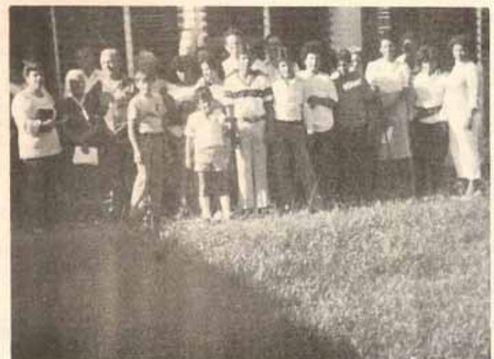
Feligreses Cristo Rey, Caguas, Puerto Rico.