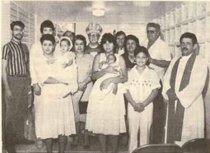
Los componentes del grupo bautismal. Iglesia El Adviento.