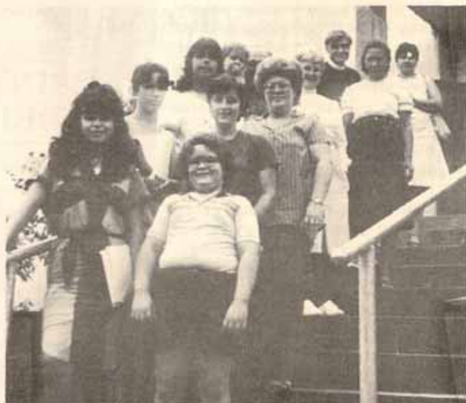
En Castañer, Lares.