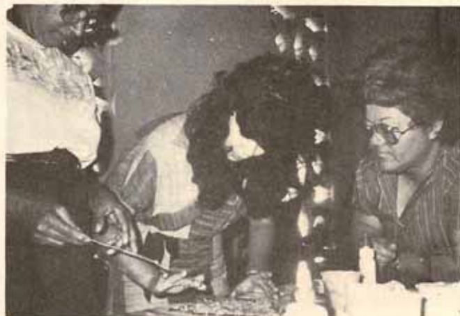
Iglesia San Bartolomé, Lares.