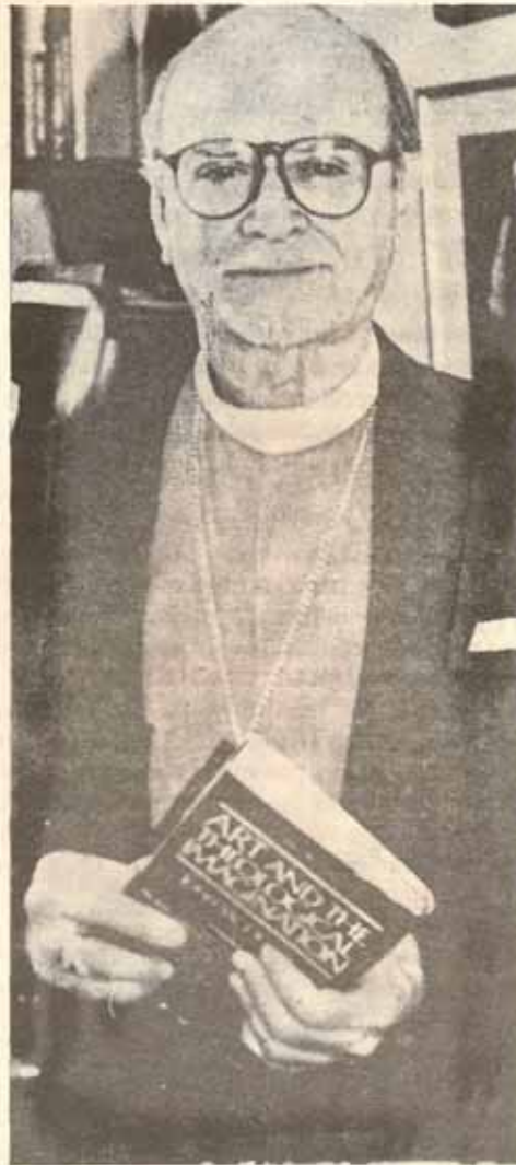
Francisco Reus Froylán, Obispo Episcopal

Comentó que “no hay un criterio que prohíba la ordenación de un homosexual en la Iglesia Episcopal como tampoco los hay en el código católico romano. Ahora, yo creo que todas las iglesias cristianas tienen un gran cuidado en quiénes ellos ordenan”. Enfatizó que la Iglesia Episcopal se preocupa por “la integridad de la persona, por sus cualidades de líder y representante de Jesús” y esto se hace “independientemente de su orientación sexual”, pues “como obispo no quiero meterme en la vida privada de un individuo”.