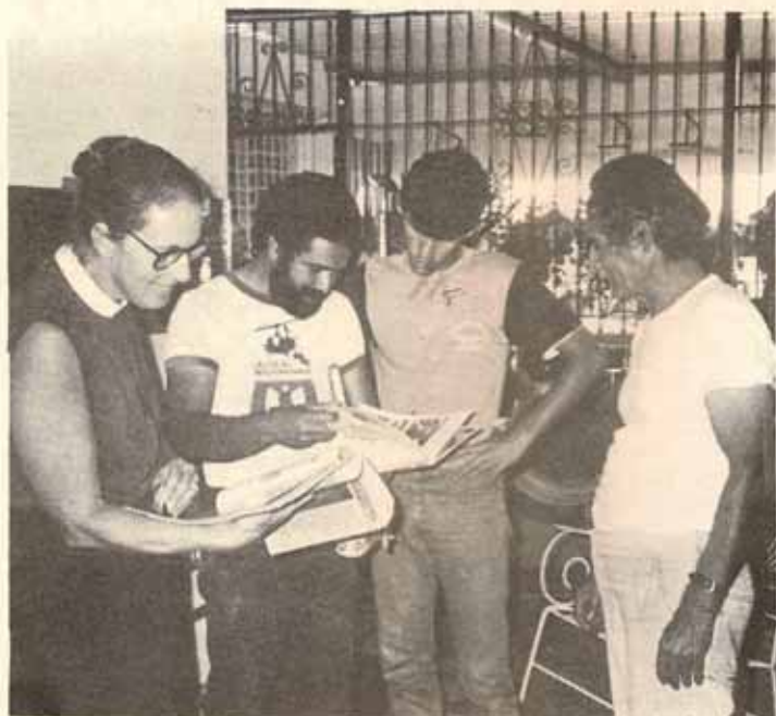
Iglesia San Miguel, Ponce.