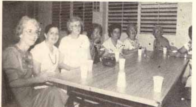
Visita a Puerto Rico de mujeres líderes de la Iglesia Episcopal de los Estados Unidos.