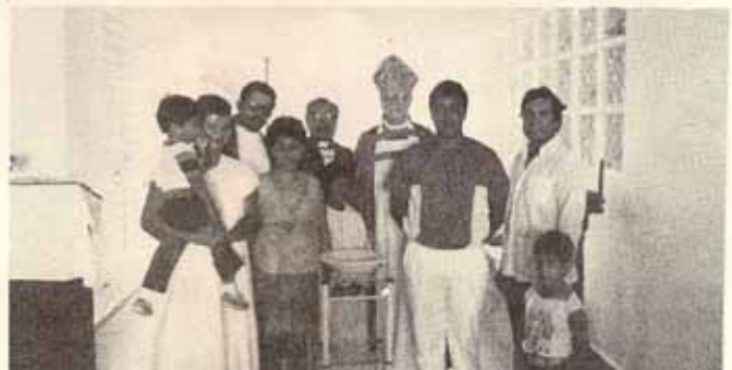
Visita pastoral Iglesia El Adviento Villa Fontana, Carolina, P.R.