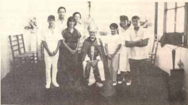
Visita pastoral Iglesia Santa María Magdalena, Levittown, P.R.