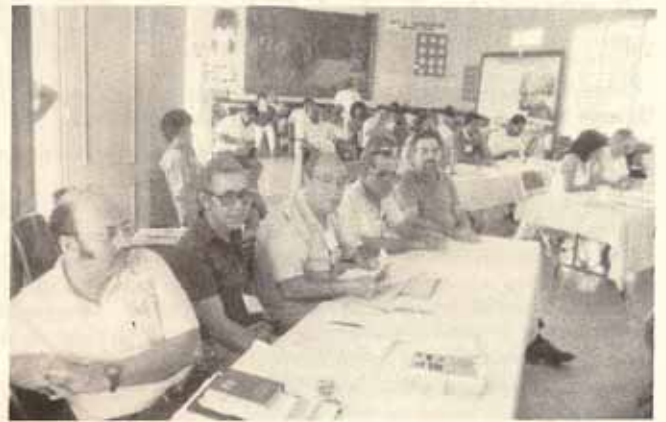
Delegación de Puerto Rico en el X Sínodo en Santo Domingo