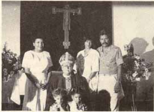
Visita pastoral Iglesia San José Bo. Caimito, Río Piedras, P.R.