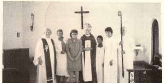
Visita pastoral Iglesia San Lucas, Ponce, P.R.