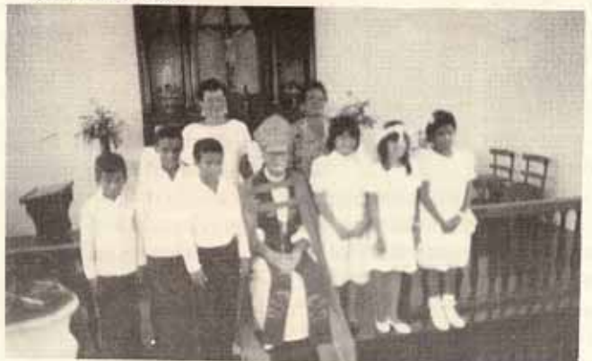
Visita pastoral y confirmación Iglesia Todos los Santos Vieques, P.R.