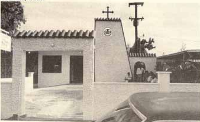
Iglesia San Francisco de Asís, Urb. El Comandante, Río Piedras, P.R.