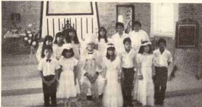
Visita pastoral y confirmación Iglesia La Reconciliación Bo. Quebrada Limón, Ponce, P.R.