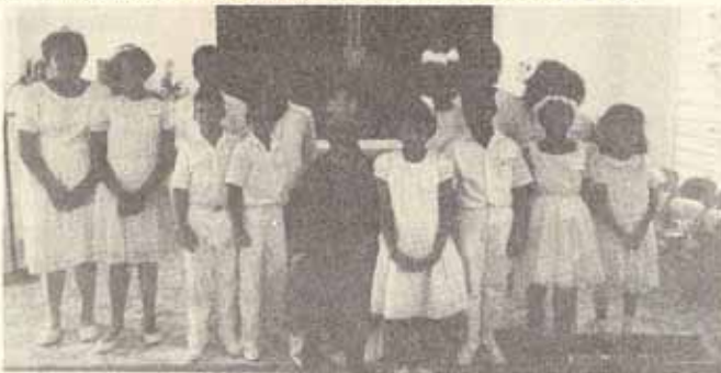
Confirmación Iglesia San José Bo. Caimito, Río Piedras, P.R.