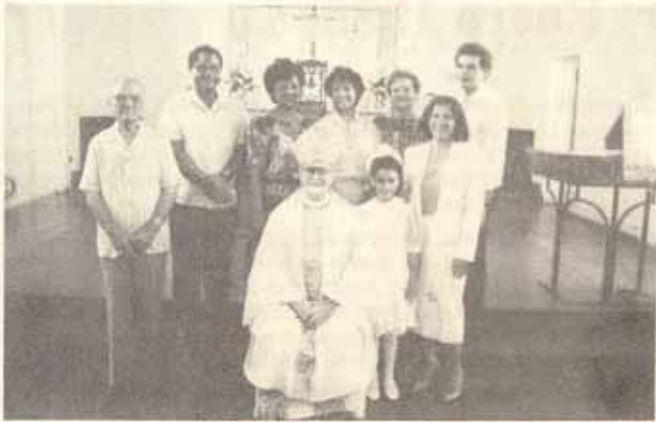
Visita pastoral y confirmación Santa Iglesia Catedral Episcopal Parada 20, Santurce, P.R.