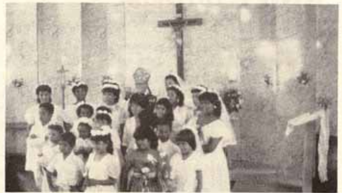
Visita pastoral y confirmación Iglesia San Miguel Ponce, P.R.