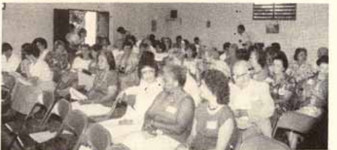
Conferencia de mujeres de Estados Unidos, celebrada en la Iglesia Santa Hilda, Trujillo Alto, P.R.