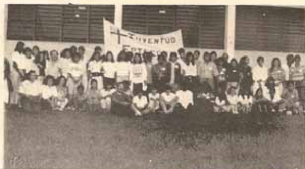
Juventud presente en retiro de Adviento en Iglesia Santa Hilda.