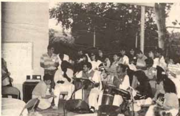
Cánticos en retiro de Adviento dirigido por los Monjes Providentinos en Iglesia Santa Hilda.