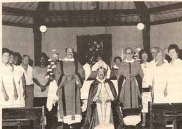
Visita pastoral Iglesia Santo Tomás Apóstol, Bo. Martín González, Carolina, P.R.