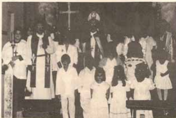
Visita pastoral Iglesia San Andrés, Mayagüez, P.R.