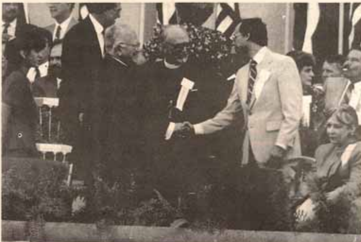
Obispo Reus pronuncia la invocación en la toma de posesión del Gobernador de P.R.