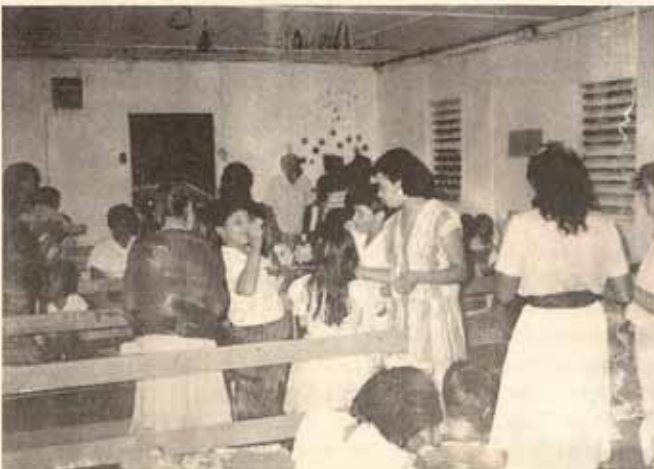
Fiesta de reyes y visita pastoral Iglesia La Epifanía, Bo. Indiera, Maricao, P.R.