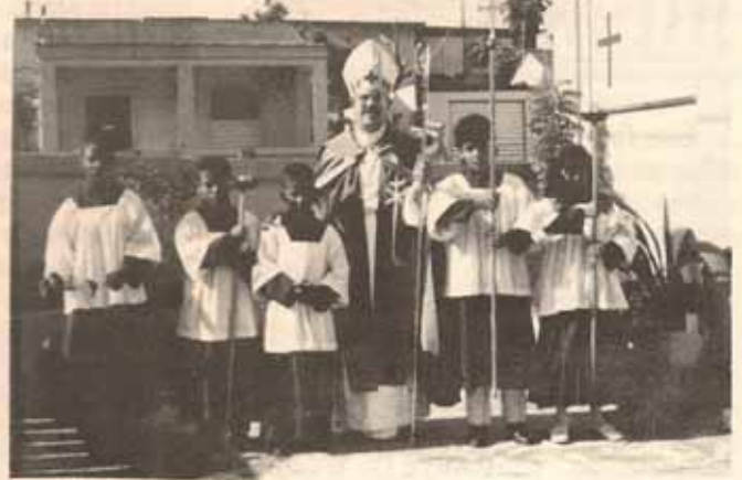
Grupo de monaguillos Iglesia Todos los Santos, Vieques, P.R.