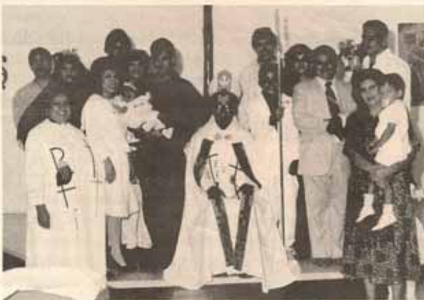
Visita pastoral Iglesia Santo Nombre de Jesús, Bo. Pastillo, Ponce, P.R.