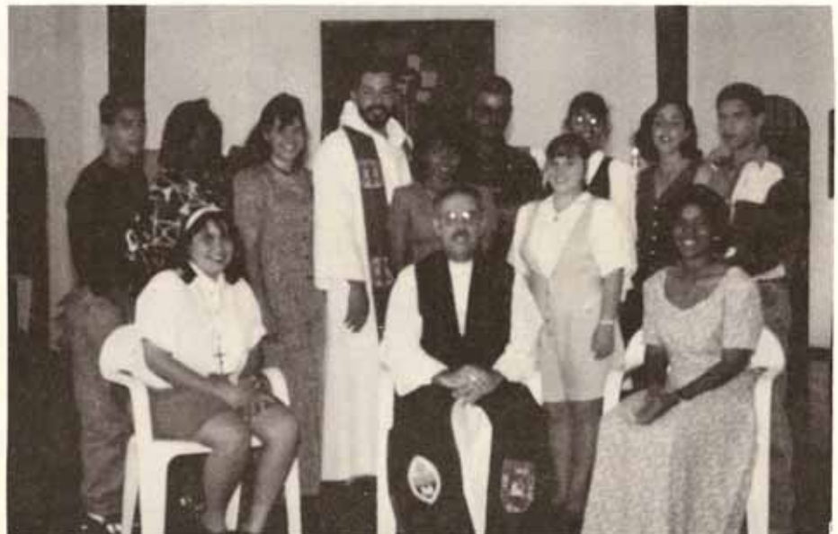
Instalación de la nueva directiva de la Juventud Diocesana G.E.N.E.S.I.S. celebrada en la Iglesia Santo Tomás Apóstol, en Carolina.