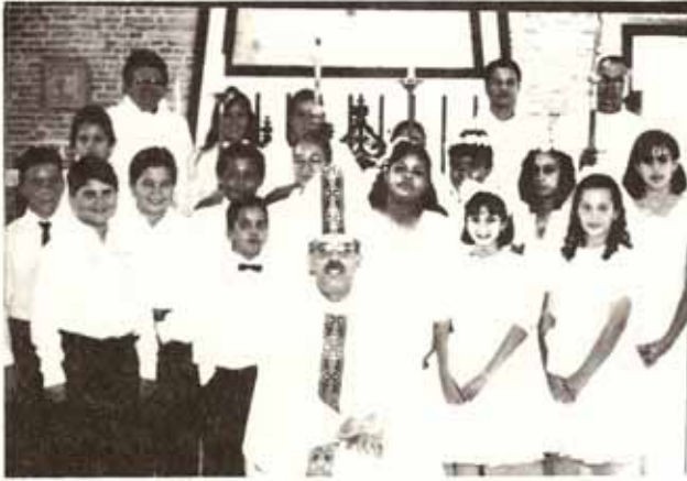
Confirmaciones en Visita Pastoral a la Iglesia La Reconciliación, Bo. Quebrada Limón, Ponce.