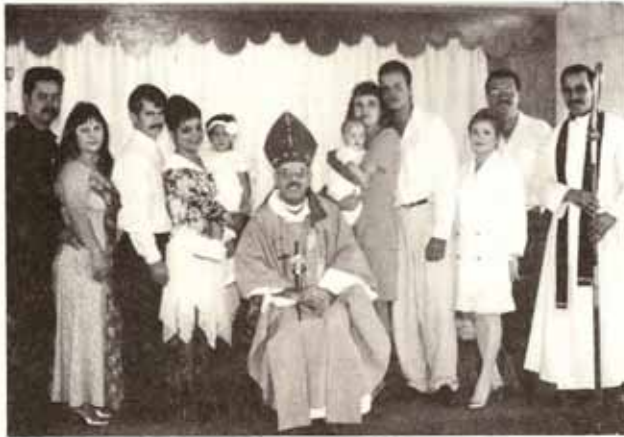
Bautismos, Cofirmaciones, y Recepciones en Visita Pastoral a la Iglesia San Matías, Lares.