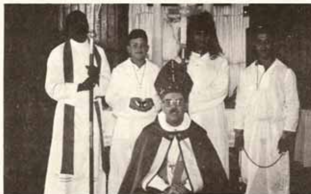
Cuerpo de acólitos de la Iglesia El Buen Pastor Fajardo