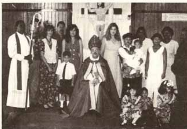
Bautismos, Confirmaciones y Recepciones en Visita Pastoral a la Iglesia El Buen Pastor, Fajardo.