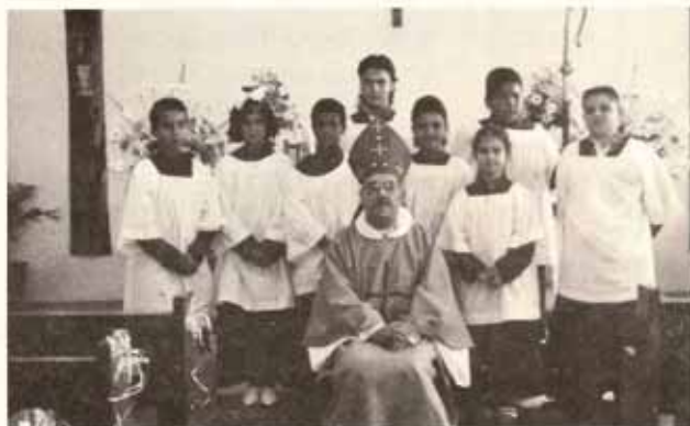
Cuerpo de acólitos de la Iglesia Santa Hilda Trujillo Alto