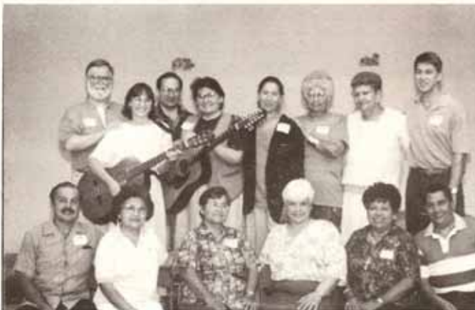
Equipo del ministerio SOMA y de nuestra Diócesis que participó en retiro sobre "La Vida En El Espíritu" celebrado en mayo 15 - 16.

Para estar bien informados de toda la vida y misión de la Iglesia Episcopal Puertorriqueña, CREDO es el medio y recabamos tu apoyo.