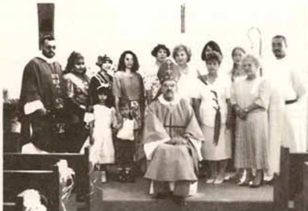
Confirmaciones y Recepciones en Visita Pastoral a la Iglesia Santa Hilda, Trujillo Alto