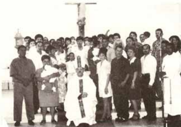
Bautismos, Confirmaciones, y Recepciones en Visita Pastoral a la Iglesia La Resurrección, Manatí.