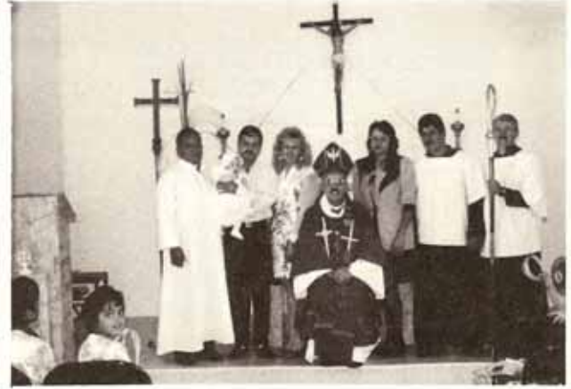
Bautismos en Visita Pastoral a la Iglesia La Anunciación a la Virgen María, Yauco.