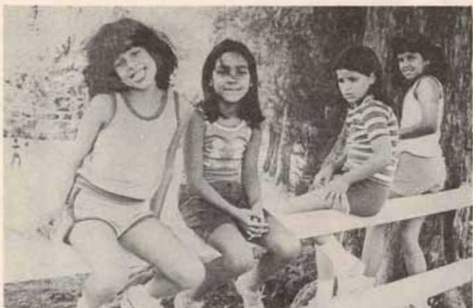
Participantes Campamento de Verano.