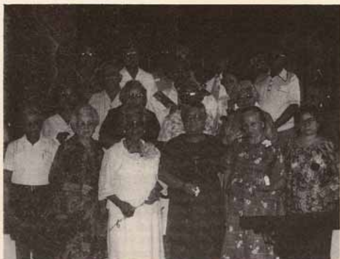
Celebración del día del envejeciente, Iglesia San Andrés, Mayagüez.