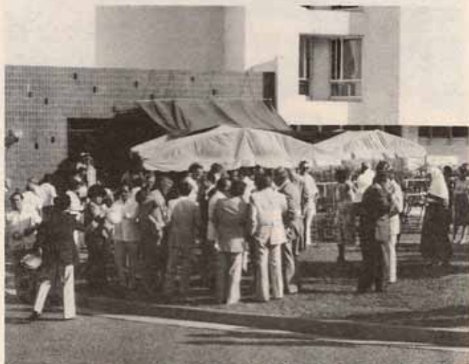
Concurrencia acto colación 1ra. Piedra Hospital San Lucas.