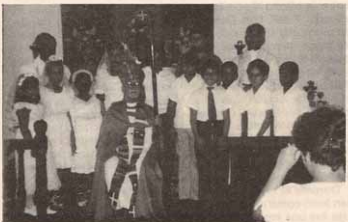
Visita Pastoral, Iglesia Todos los Santos Vieques.