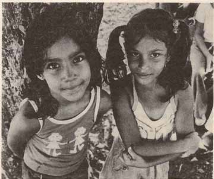
Participantes Campamento de Verano.