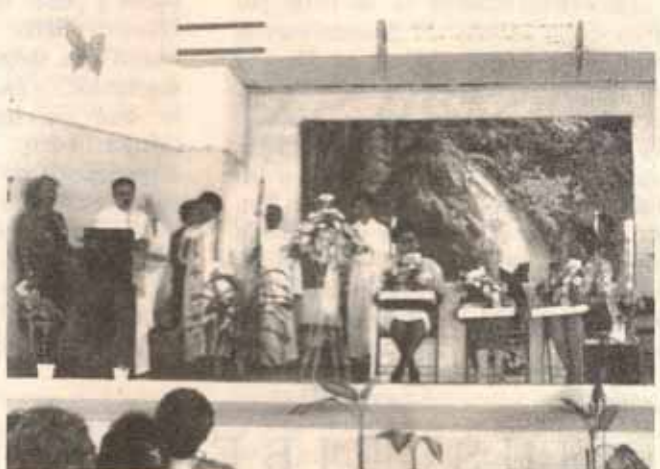
Convención de Mujeres Episcopales.