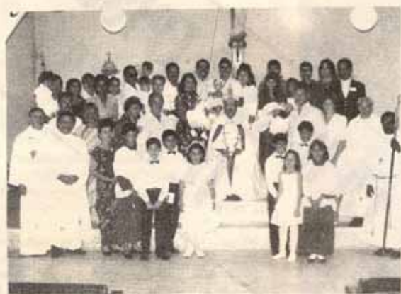
Bautismos, confirmaciones y recepciones en Visita Pastoral a la Iglesia La Resurrección en Manatí.