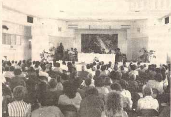
Vista parcial de la asistencia a la Convención de Mujeres Episcopales celebrada en Ponce.