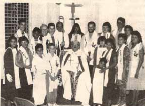
Confirmaciones y recepciones durante la Visita Pastoral a la Iglesia San Lucas, Ponce.