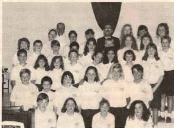
Coro de niños "Casa de Oración" procedentes de Minnesota, quienes nos visitaron durante la pasada Semana Santa.