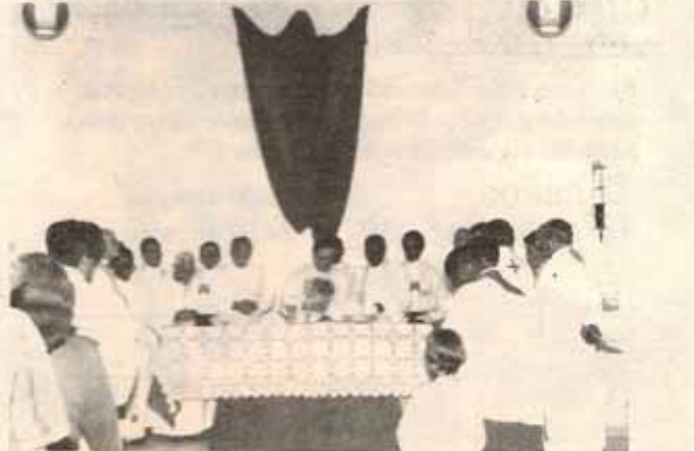
Celebración de la Renovación de Promesas de Ordenación en la Iglesia La Encarnación en Hato Rey.