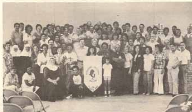
Parte de los asistentes al taller en Juana Díaz - poniendo la oración en práctica. Hay representantes de 16 de nuestras Iglesias en P.R.