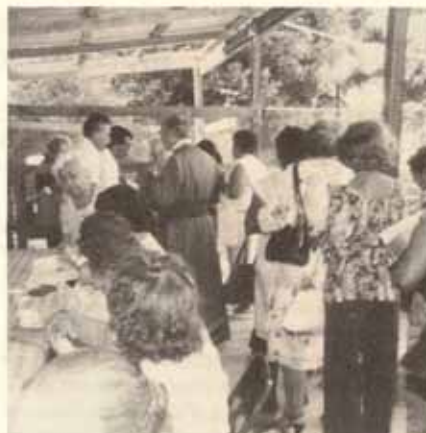
El Sr. Obispo comparte con los caballeros de San José. Las mujeres hacen turno para desayunar.

Como nota simpática y de mucha tradición se seleccionó a la Mujer Episcopal del Año, resultando ser una dama de la Iglesia Santo Nombre, del Barrio Pastillo de Ponce. Fue coronada en medio de mucha emoción, en un escenario hermosamente preparado por los jóvenes de San José.