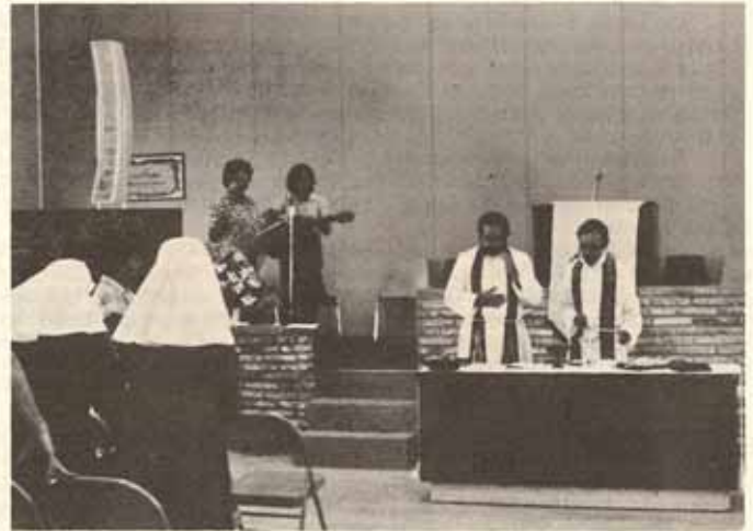
Eucaristía en el Taller de Oración