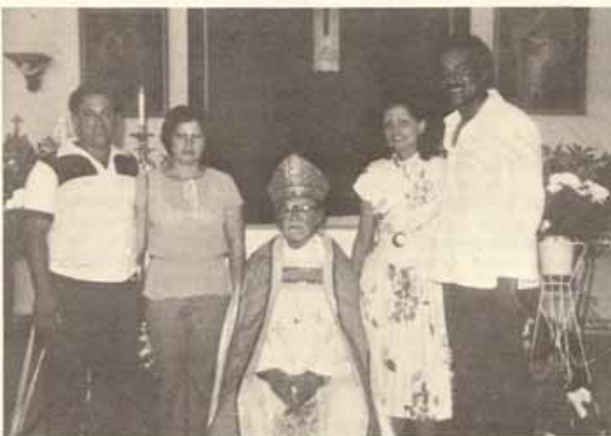
Recepciones en Visita Pastoral, Iglesia La Resurrección, Manatí