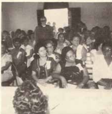
Algunas de las mujeres reunidas, acompañadas por el Sr. Obispo.

Las siguientes iglesias obtuvieron placas por mejor asistencia, MISIONES: San Marcos de Ponce, primer premio, con 26 mujeres, San Miguel, segundo premio, con 14 mujeres; La reconciliación del Barrio Quebrada Limón en Ponce, tercer premio, con 9 mujeres. PARROQUIAS: Santa María Virgen de Ponce, primer premio con 9 mujeres, Stma. Trinidad de Ponce,