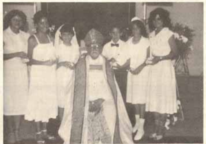
Clase de Confirmación, Iglesia La Resurrección, Manatí