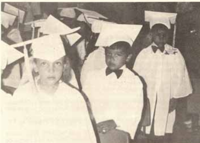
Clase Graduanda, Escuela Sta. María Virgen, Ponce