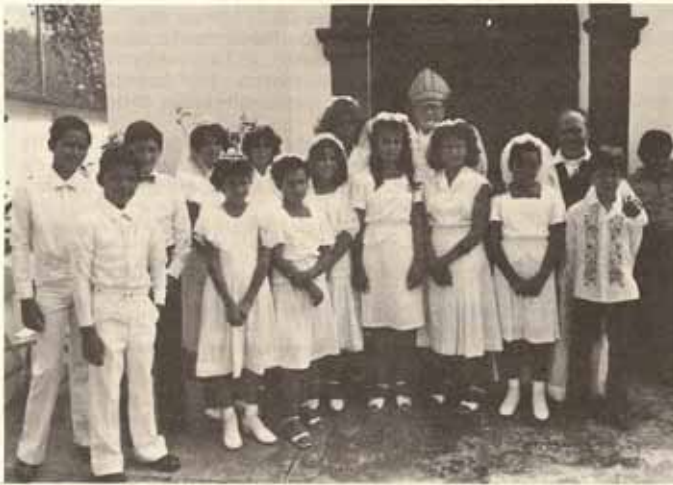
Visita Pastoral, Iglesia San Marcos, Ponce