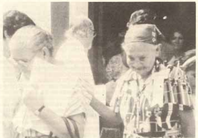
Participantes en la Convención de Damas