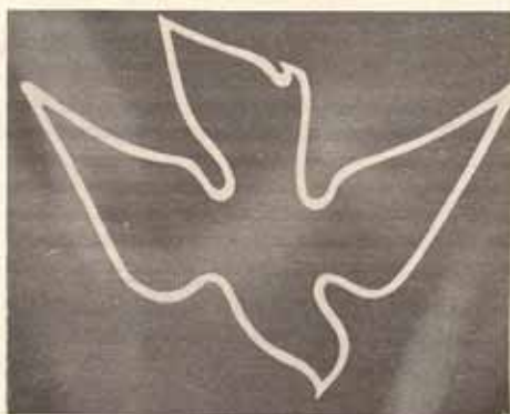
MENSAJE DE PENTECOSTES por el Obispo Francisco Reus

Habrán algunos de los que lean este mensaje que crean que su iglesia o congregación está, espiritualmente, "viva". Por lo menos, estos oran, dan y trabajan para que así sea y sería para ellos bien decepcionante enterarse que su amada iglesia no es una congregación "viva". Otros, menos ingenuos, saben que no hay "fuego" en su iglesia y están pensando en mudarse a la iglesia vecina o quedarse en su casa. (Por lo general el episcopal disgustado no se une a otra confesión: se muda de parroquia o no va a ninguna.)