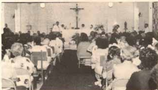
Vista parcial de la asamblea de la Sociedad de Mujeres Episcopales celebrada en Arecibo, P.R.