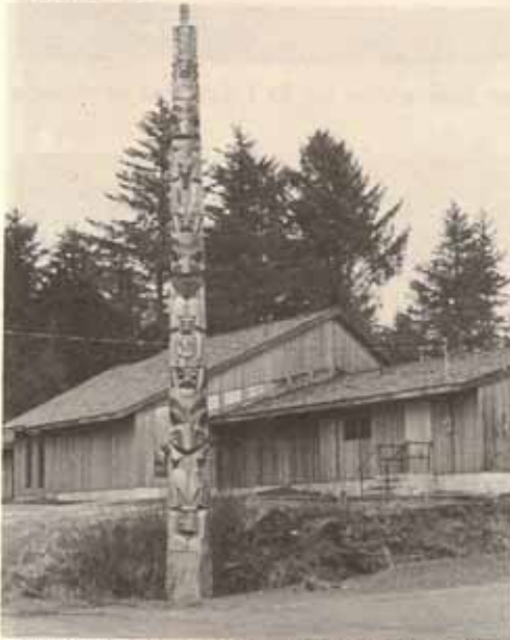
Iglesia San Juan Evangelista de Masset-Islands Reina Carlota de la Columbia Británica, Canadá. En el palo "Totem" está escrita la historia de la congregación.