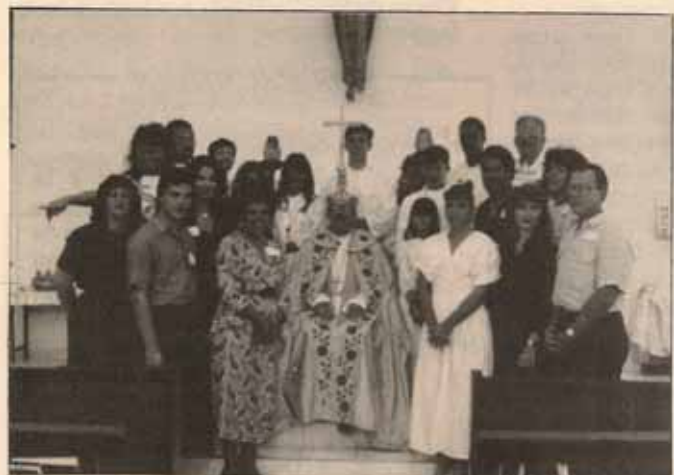
Visita Pastoral Iglesia La Encarnación, Bda. Roosevelt, Hato Rey, P.R.