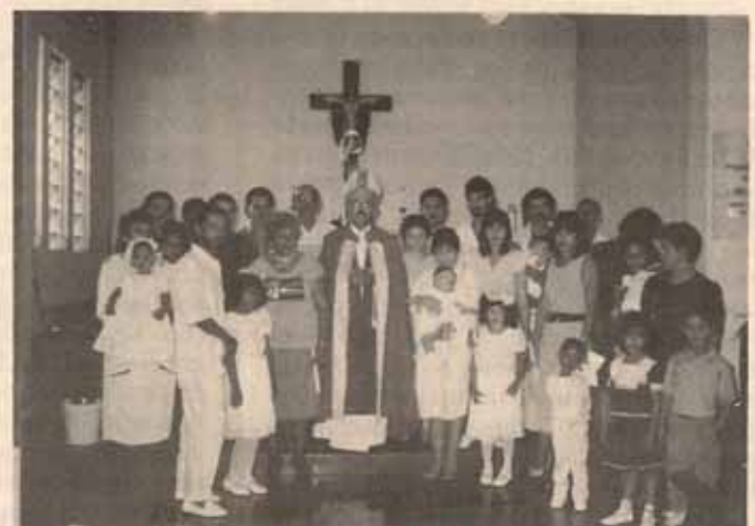
Visita Pastoral a la Iglesia La Sagrada Familia, Saint Just, Puerto Rico.