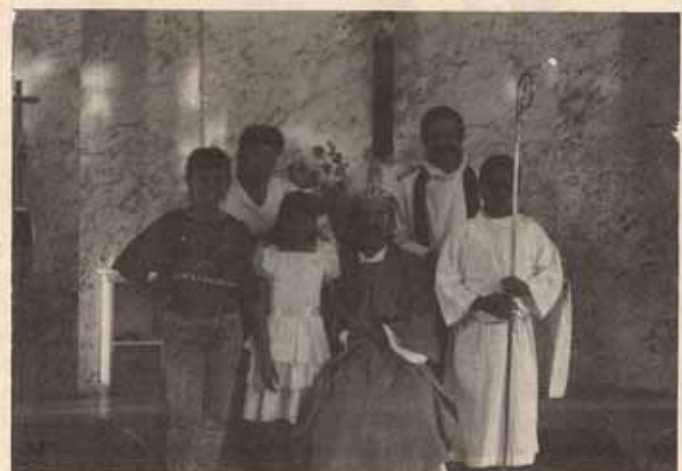
Visita Pastoral especial a la Iglesia San Miguel Arcángel, Ponce, Puerto Rico.