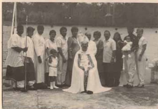
Visita Pastoral Iglesia San Marcos, Ponce, P.R.