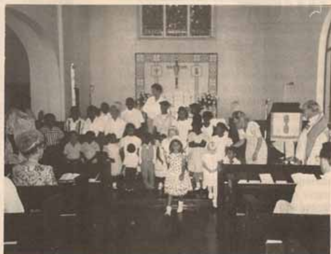
El Obispo Reus con niños en la Catedral el día de Resurrección.