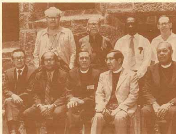
Obispos de la IX Provincia

Miembros del Consejo Provincial de la IX Provincia.