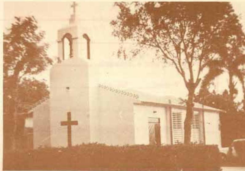
La Iglesia La Ascensión- Barahona