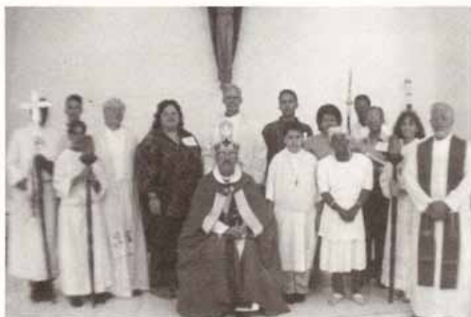
Confirmaciones y Recepciones en Visita Pastoral a la Parroquia La Encarnación en Urb. Roosevelt, Hato Rey.