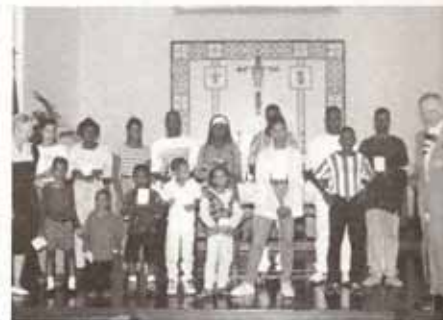
Grupo de Jóvenes de la feligresía de Habla Inglesa de la Catedral San Juan Bautista.

"Porque El es el verdadero cordero pascual, que en la fiesta de la Pascua pagó por nosotros la deuda de la culpa de Adán y por medio de su sangre libró a tu pueblo fiel." (L.O.C., pág. 207)