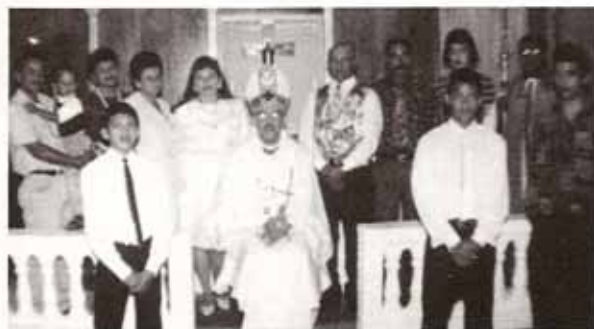
Bautismos en Visita Pastoral a la Iglesia San Pedro Apóstol, Coamo.