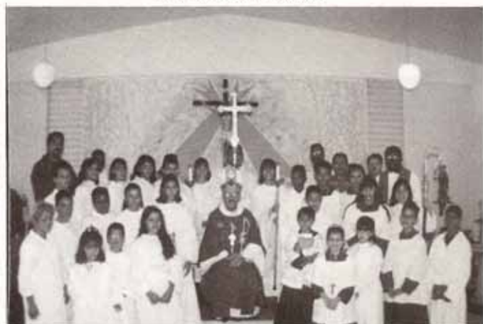
Confirmaciones y Recepciones en Visita Pastoral a la Iglesia San Pablo Apóstol, Arecibo.