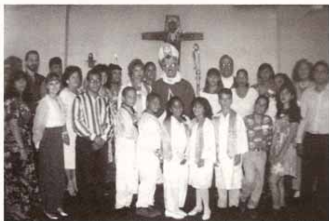
Confirmaciones y Recepciones en Visita Pastoral a la Iglesia Cristo Rey en Caguas.