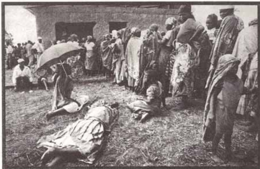
Refugiados ruandeses esperan afuera de una clinica en el Campamento Benaco en Tanzania