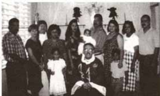
Bautismos en la Visita Pastoral a la Iglesia La Epifanía, Bo. Indiera, Maricao.

Felicitemos a toda nuestra juventud, a la directiva saliente y entrante y pedimos la bendición de Dios en sus trabajos en este nuevo año.