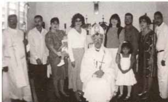
Bautismos en Visita Pastoral a la Iglesia La Sagrada Familia en St. Just, Trujillo Alto