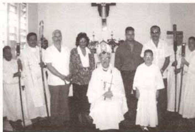
Confirmaciones y Recepciones en Visita Pastoral a la Iglesia La Sagrada Familia en St. Just, Trujillo Alto.