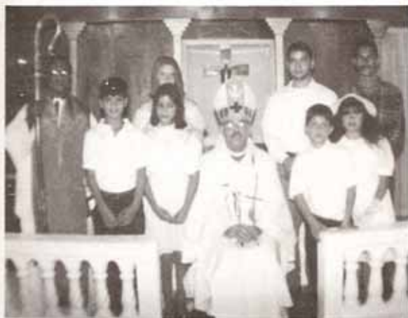
Confirmaciones en Visita Pastoral a la Iglesia La Epifanía, Bo. Indiera, Maricao.

Los Obispos Primados pusieron en práctica el consejo de Tutu mediante una carta al Obispo de Londres, David Hope, quien en una conferencia de prensa admitió ambigüedades en su sexualidad y las campañas para acusarlo de parte de grupos pro y contra la homosexualidad.