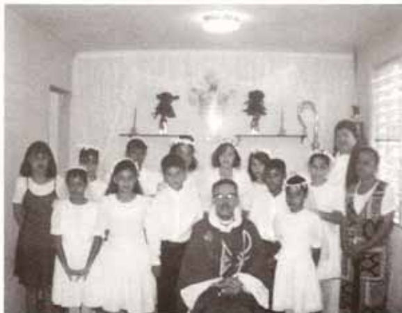
Confirmaciones en la Visita Pastoral a la Iglesia San Pedro Apóstol, Coamo.