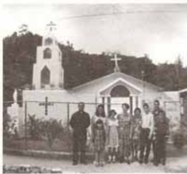
Vista exterior de la Iglesia La Epifanía en el Bo. Indiera de Maricao.

Fue remodelada con ayuda del Proyecto Diocesano de las Mujeres Episcopales de Puerto Rico.