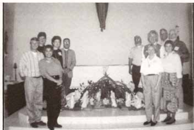
Grupo de visitantes de la Diócesis de North Carolina a su parroquia compañera en Puerto Rico.