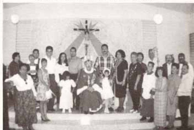
Acólitos participantes en el II Festival de cólitos celebrado en la Iglesia San Pablo Apóstol, Arecibo.