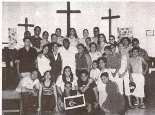
Algunos de los participantes de la Vigilia Pascual "Muestrame tu Rostro" en el Campamento Cumbre del Calvario en Arecibo del 9 al 11 de abril.