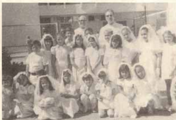
Confirmados en la Parroquia Santísima Trinidad de Ponce.