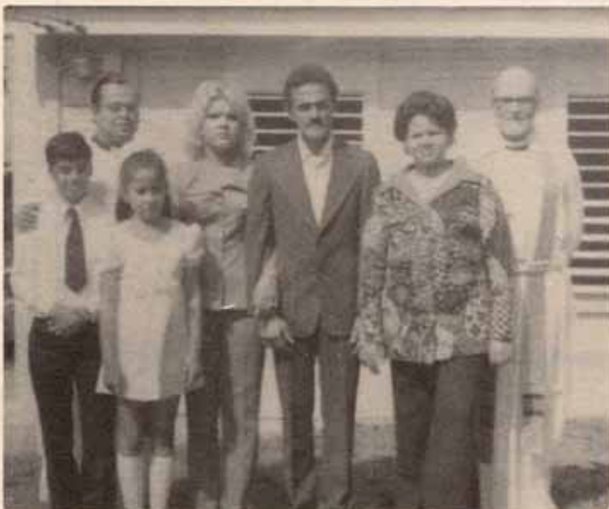
Visita Pastoral y confirmados en la Iglesia de Sta. Hilda.