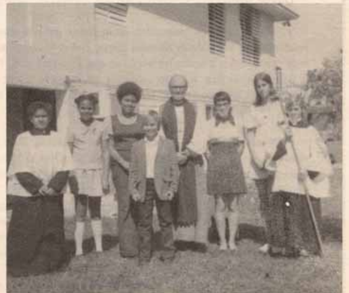
Confirmación en San Esteban.