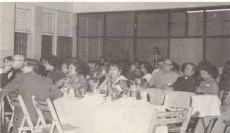
Otro grupo del banquete.