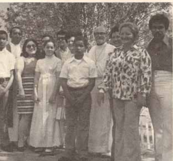
Grupo de confirmados en La Encarnación.