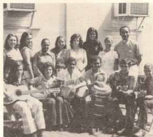
Grupo musical de La Encarnación.