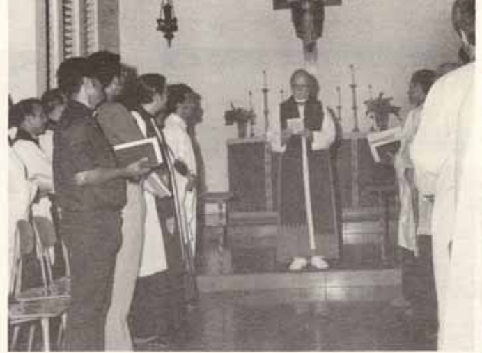
Oficio de apertura de la pasada Convención Diocesana. El Obispo Reus dando la bienvenida.