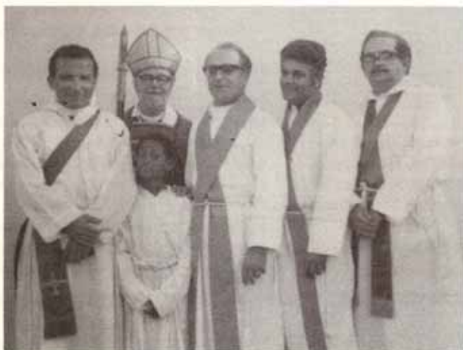
Instalación del P. Parodi en la Iglesia de San Francisco de Asís.