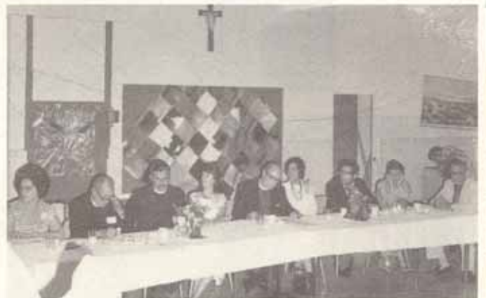
Mesa presidencial del tradicional banquete de Convocación. Grupo parcial del banquete.