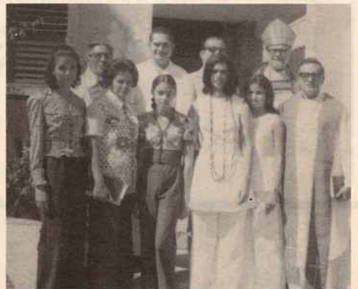
Clase confirmada en la Parroquia de San Andrés de Mayagüez.