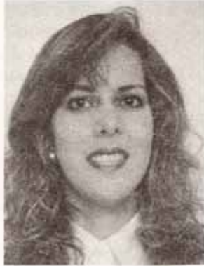
Por: Omayra Chardón

Entre los múltiples compromisos que mantiene la Iglesia Episcopal Puertorriqueña a través de los años, se encuentra el brindar una educación de excelencia a su estudiantado que circula entre cinco colegios acreditados por el Departamento de Educación.