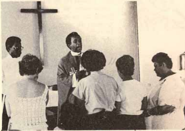
INICIACION DAMAS EPISCOPALES Iglesia Buen Pastor — Fajardo