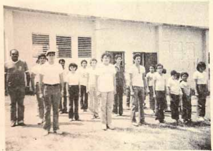
TROPA NIÑOS ESCUCHAS Iglesia Resurrección — Manatí