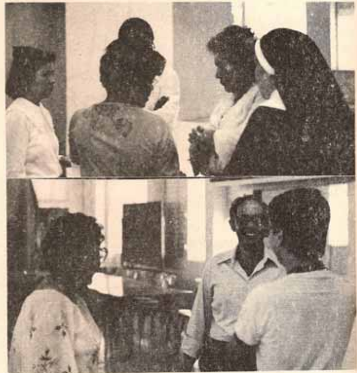
Candidatos al ministerio de la iglesia durante reunión con alumnos del Programa ESTUDIO.