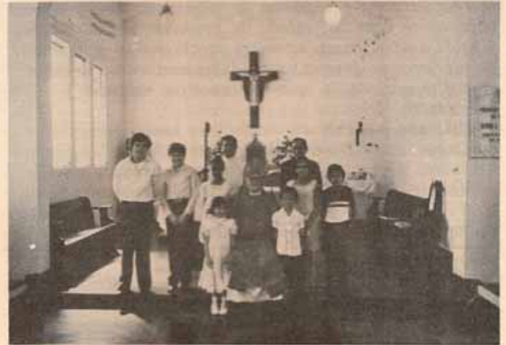
Confirmación Iglesia Sagrada Familia Saint Just. Trujillo Alto, P.R.