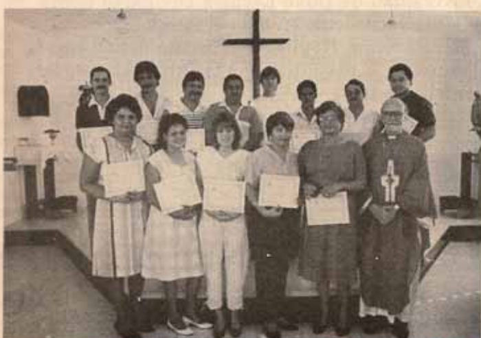
Instalación Junta Parroquial Iglesia Santo Nombre Bo. Pastillo. Ponce, P.R.