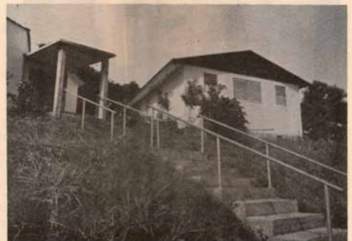
Iglesia La Santa Cruz, Bo. Castañer. Lares, P.R.