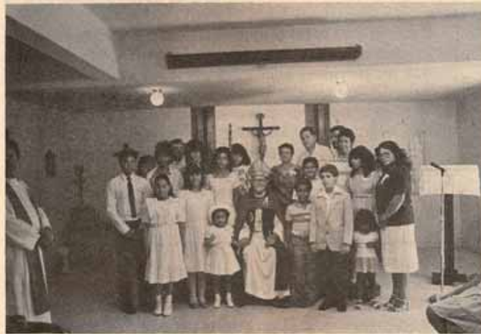
Confirmación Iglesia San Francisco de Asis, Urb. El Comandante. Río Piedras, P.R.