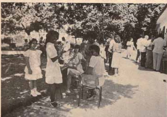
Visita Pastoral Iglesia Sagrada Familia, Saint Just. Trujillo Alto, P.R.