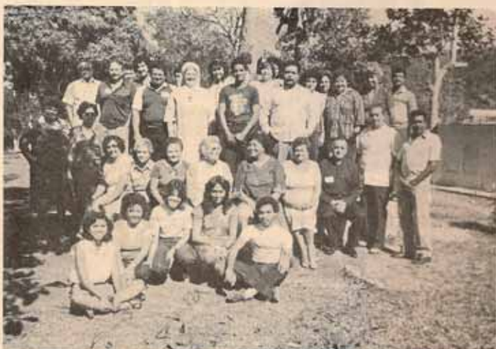
Taller de Líderes Campamento El Coquí Poblado El Rosario. Mayagüez, P.R.