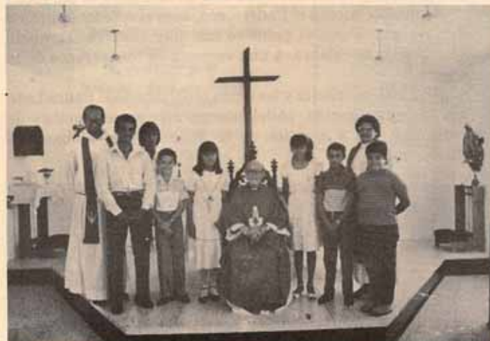
Confirmación Iglesia Santo Nombre, Bo. Pastillo. Ponce, P.R.