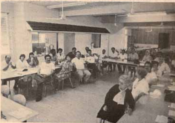
Taller de líderes en San Justo.