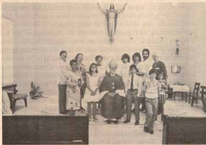
Confirmación Iglesia La Encarnación, Bo. Roosevelt. Hato Rey, P.R.