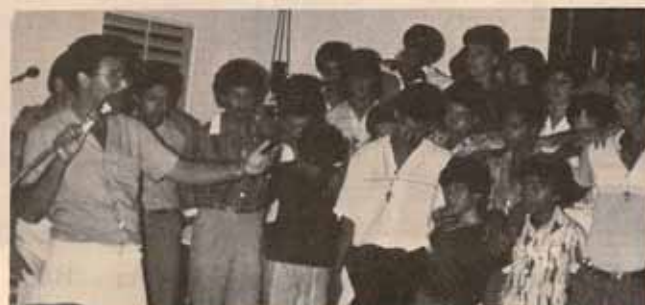
Retiro jóvenes, la Resurrección.

CREDO los felicita y les desea mucho éxito al Padre León y a la congregación. ¡Adelante para poner el nombre de Cristo en alto y a quien se le debe toda la alabanza y adoración.