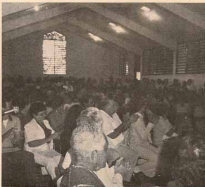
Inauguración Iglesia Santa Hilda, Bo. Las Cuevas. Trujillo Alto, P.R.