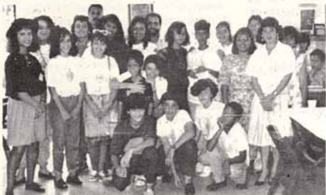
Actividad de jóvenes de las Iglesias de San Andrés y San Mateo.