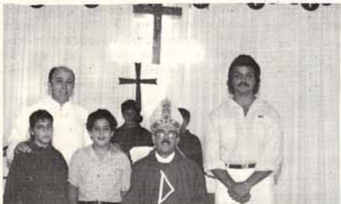
Visita Pastoral Iglesia El Adviento, Villa Fontana Carolina.