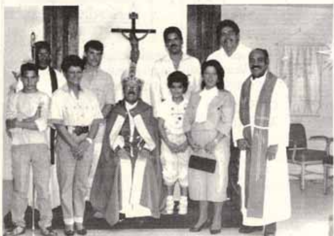
Visita Pastoral Iglesia San Francisco de Asís, El Comandante, Río Piedras.