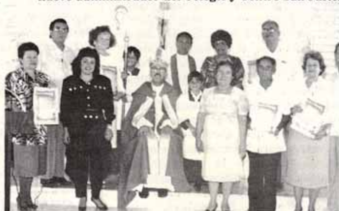
Líderes laicos que recibieron certificados de reconocimiento por su labor en la Iglesia San Pablo, de Arecibo.