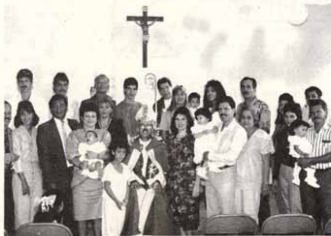
Visita Pastoral Iglesia Santa Hilda, Trujillo Alto.