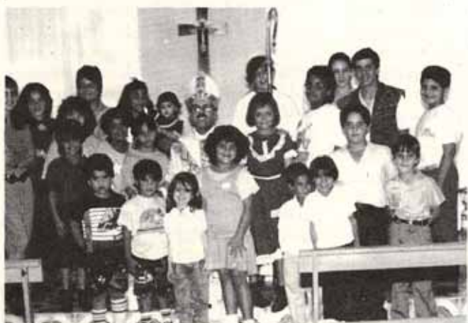
Jóvenes y niños de la Iglesia La Epifanía, Bo. Indiera de Maricao.