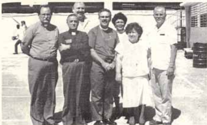
Directores de las Escuelas Episcopales de Puerto Rico.