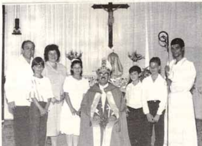
Visita Pastoral Iglesia La Santa Cruz, Bo. Castañer, Lares.