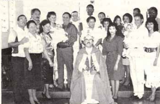
Visita Pastoral Iglesia La Sagrada Familia, Bo. San Justo, Trujillo Alto.