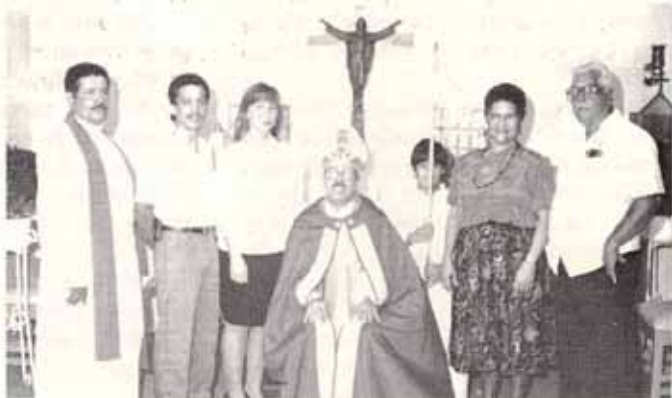
Visita Pastoral Iglesia San Bartolomé, Bo. Bartolo, Lares.