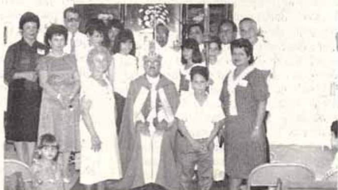
Visita Pastoral Iglesia San Rafael, Yauco.