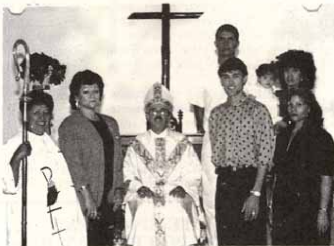
Visita Pastoral Iglesia Santo Nombre, Bo. Pastillo, Ponce.