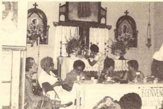
La Directiva de las Damas en Acción.