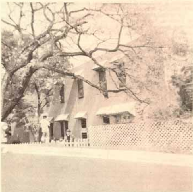
El Convento de la Transfiguración en Ponce, donde se ofrecerán las conferencias.

Si alguien no puede quedar todo el tiempo puede asistir por una semana, o del 1 al 8 de junio o del 8 al 15. Si tienes interés en el programa escribe a Sister Majorie Hope, Box 1991, Ponce, Puerto Rico, 00731, antes del día 15 de mayo.