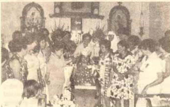
Nuestro Señor Obispo ofreciendo un concierto de guitarra, durante el almuerzo, en la Convención de Damas, en Ponce.