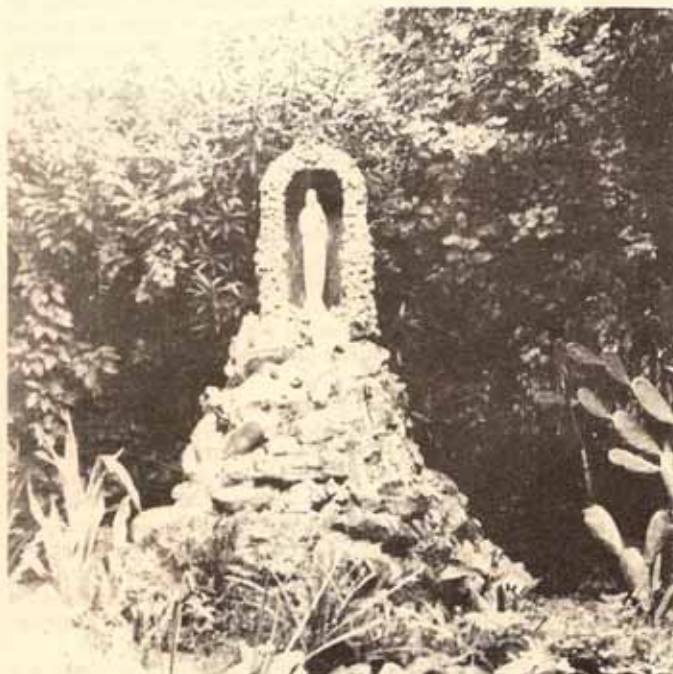
El Patio del Convento