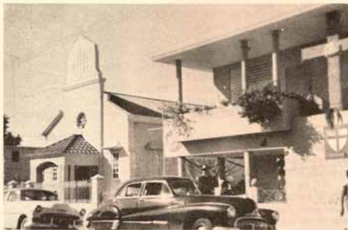
Santa María Virgen, en Ponce, P.R. donde se celebró la Convención de Damas.