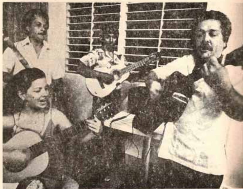
Un grupo musical episcopal en la noche del banquete en la Convención de la Diócesis.