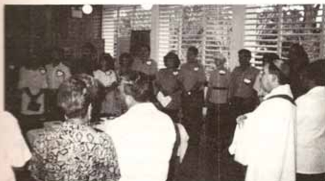
Vista parcial de las parejas participantes en el Fin de Semana de Encuentro Matrimonial Episcopal.