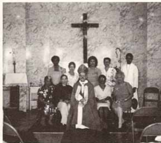
Instalación de la nueva directiva de la Sociedad de Mujeres Episcopales