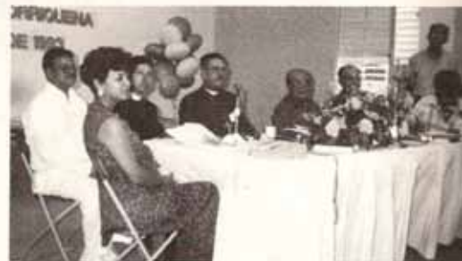
Mesa Presidencial de la 86ta. Asamblea Diocesana

Oramos que el entusiasmo, compromiso y señales de madurez eclesial que mostramos en nuestra pasada Asamblea perduren durante todo el año y demos frutos agradables para el Señor.