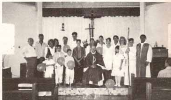
Confirmaciones, Recepciones y Bautismos en Visita Pastoral a La Santa Cruz, Castañer