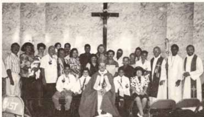
Confirmaciones, Recepciones y Bautismos en Visita Pastoral conjunta a las feligresías San Lucas y San Miguel, Ponce