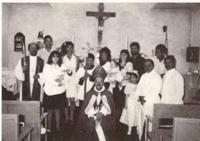
Visita Pastoral a la Iglesia San Mateo, Peñuelas