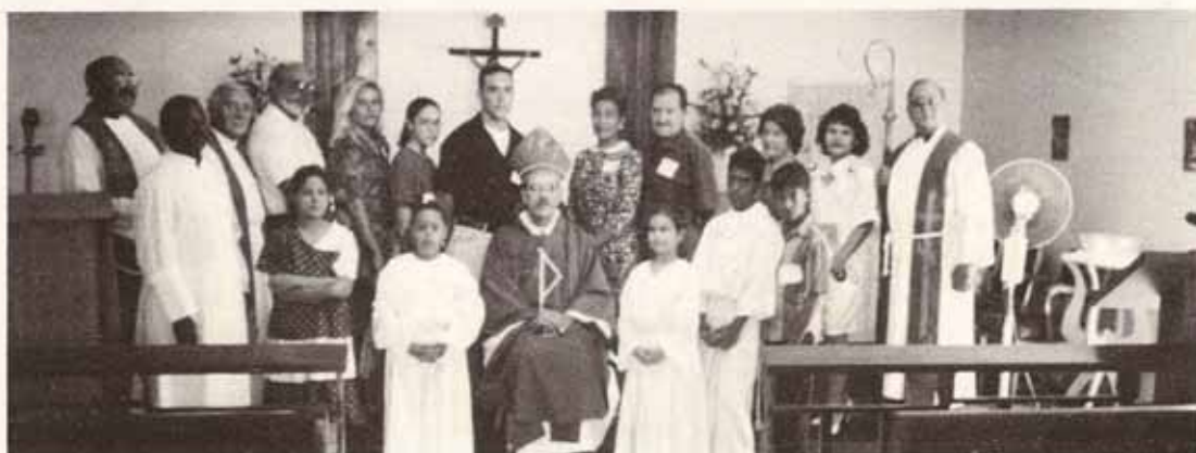
Confirmaciones y Recepciones en Visita Pastoral a la feligresía de San Francisco de Asís, Río Piedras