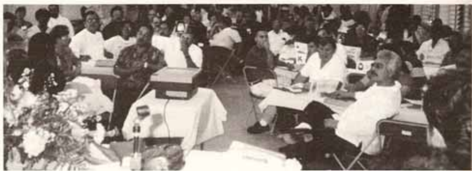
Vista parcial de las delegaciones a la 86ta. Asamblea Diocesana.