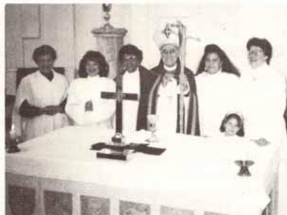
Celebración de la Década de la Ordenación de la Mujer en P.R., IX Provincia y Latinoamérica, llevada a cabo en Santa Fe de Bogotá, Colombia.