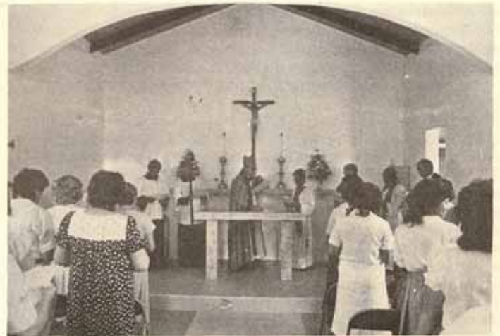
Eucaristía en la Iglesia La Anunciación, Bo. Rancheras, Yauco.