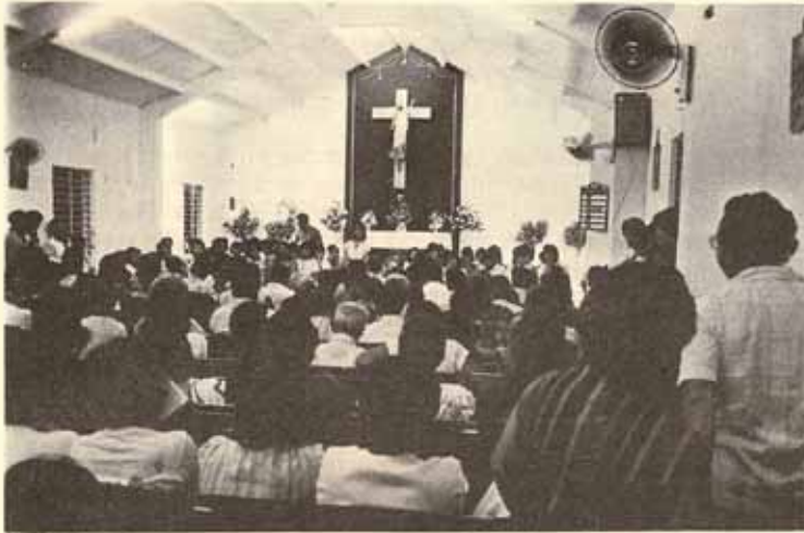
Cursillo de Cristiandad, La Resurrección, Manatí.