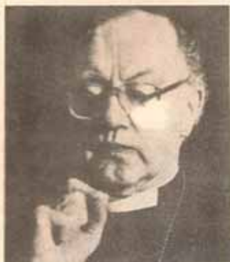
Arzobispo de Canterbury, Dr. Robert Runcie, Jefe de la Iglesia Anglicana.