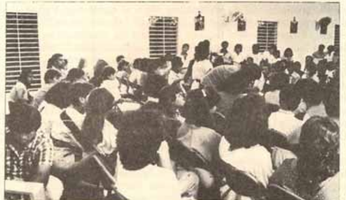
Clausura cursos de cristiandad, Iglesia La Resurrección, Manatí.