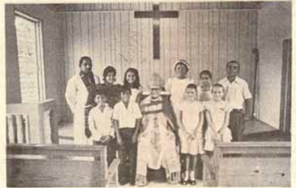
Clase de Confirmación, Iglesia La Transfiguración Bo. Rubias, Yauco.