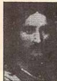
IGLESIA EPISCOPAL PUERTORRIQUEÑA

El murió para lavar tus pecados no tu mente