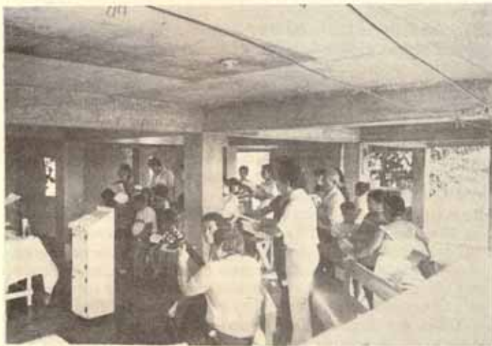
Misión Emmanuel, Maguayo, Dorado.