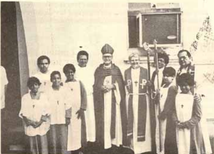
Misión Emmanuel, Maguayo, Dorado.