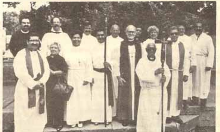
Cierre de Semestre de Estudio, Grupo de Seminaristas.