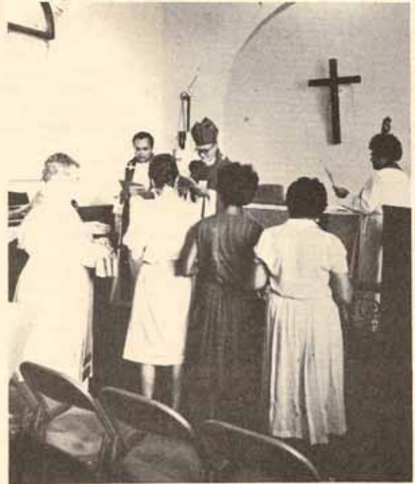
Primer aniversario de la Orden de San Bernabé y recepción de nuevas asociadas.