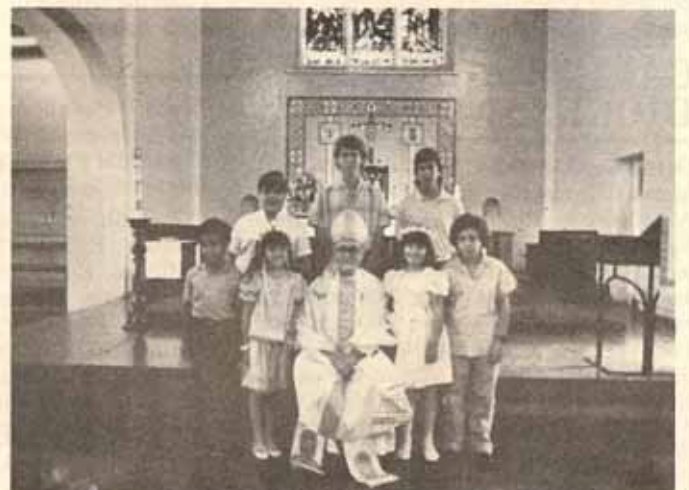
Clase de Confiración de la Catedral feligresía hispana.