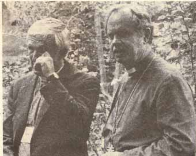
El Nuevo Primado de la Iglesia Episcopal, Edmond Browning y el Primado saliente, John Allin.

La Ofrenda de Acción de Gracias fue entregada y ascendió a $2.8 millones. Entre los asistentes se recogió la cantidad de $25,818.94. Nuestro Obispo Francisco estaba con nosotros. Tuvimos un momento precioso para participar en un servicio religioso preparado por mujeres episcopales pertenecientes a distintas tribus indias de Estados Unidos.