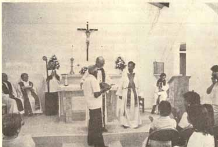
Bendición en la reconstrucción Iglesia La Anunciación, Bo. Rancheras, Yauco.