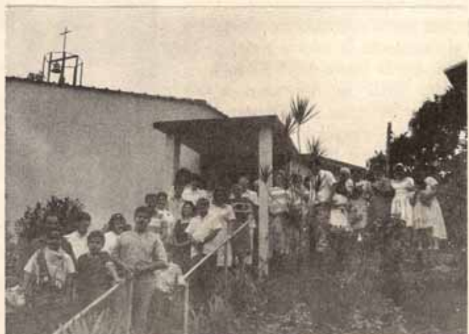
Visita pastoral Iglesia Santa Cruz, Bo. Castañer, P.R.