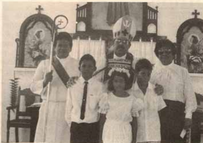
Visita pastoral Iglesia Santa María Virgen, Ponce, P.R.