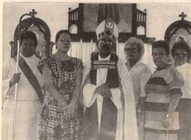
Visita pastoral Iglesia Santa María Virgen, Ponce, P.R.