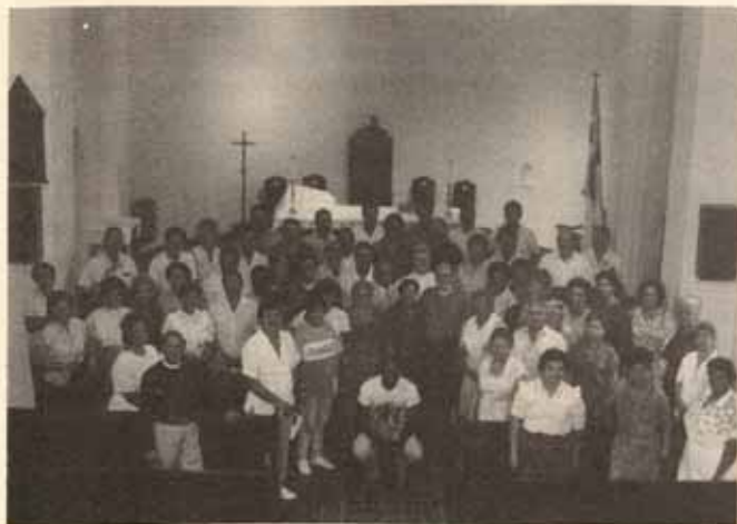
Adiestramiento de Ministerios Laicos en Iglesia Stma. Trinidad, Ponce, P.R.