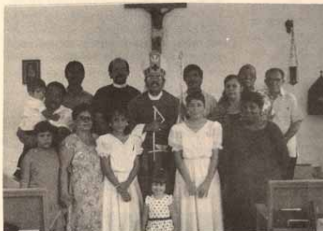
Visita pastoral Iglesia San Mateo, Bo. Quebrada Ceiba, Ponce, P.R.