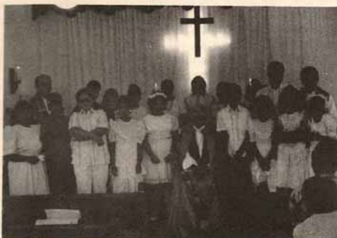
Visita pastoral Iglesia San Bartolomé, Bo. Bartolo, Lares, P.R.