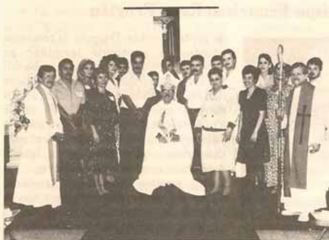
Visita pastoral Iglesia San Pedro y San Pablo de Bayamón.