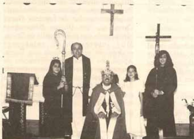
Visita Pastoral Iglesia San Bartolomé, Bo. Bartolo, Lares.