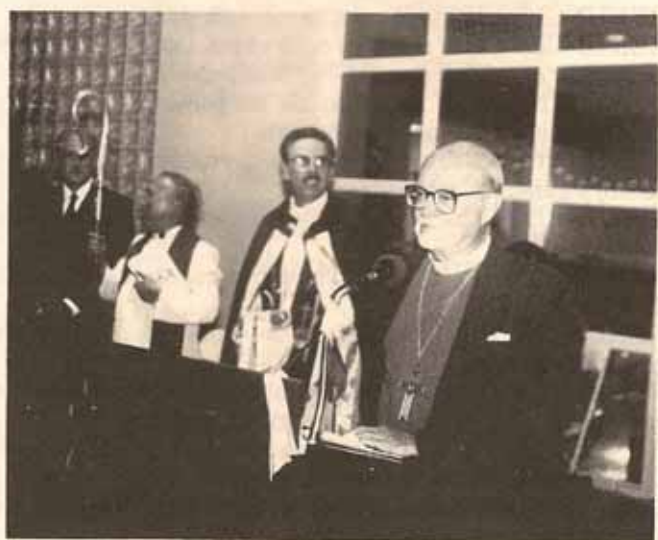
El Obispo Reus se dirige a la concurrencia en la dedicación del edificio que lleva su nombre.