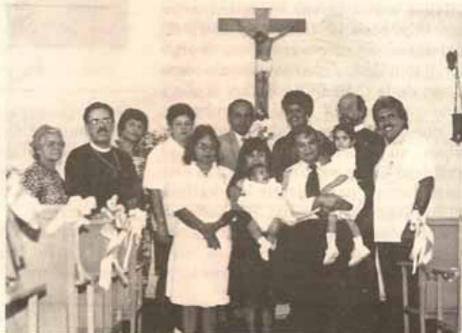
Visita Pastoral Iglesia San Mateo de Peñuelas.