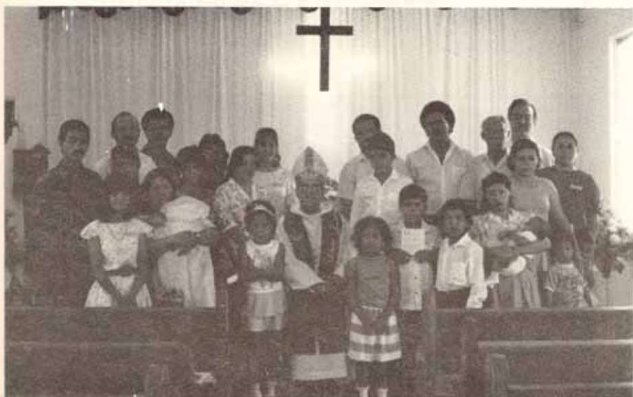
Confirmaciones y Recepciones Visita Pastoral Iglesia San Bartolomé