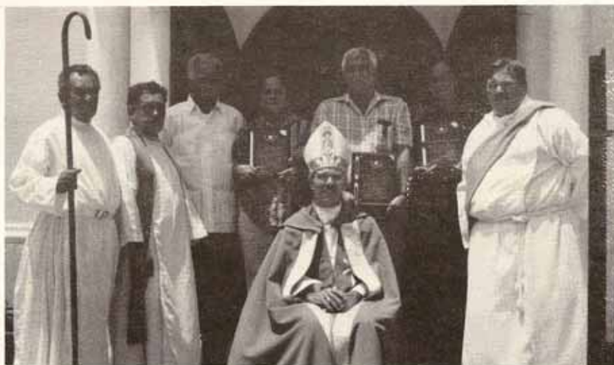
Reconocimientos durante Visita Pastoral San Rafael