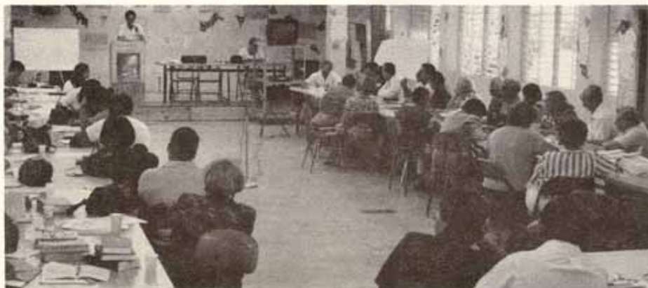
Vista parcial de participantes en Taller sobre Evangelización para Laicos celebrado en el Centro San Justo.

Jóvenes participantes del programa de intercambio con la diócesis de Connecticut. Esta foto en ocasión de su visita a la ciudad de Nueva York.