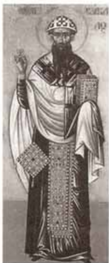
San Cirilo de Alejandría

Entre el final del Concilio de Constantinopla en el año 381 y el inicio del Concilio de Éfeso en el año 431, el Imperio Romano pasó por una serie de cambios políticos que tuvieron profundos efectos sobre la unidad del cristianismo.