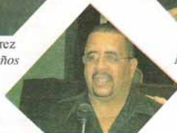
Angel Quiñones Misión San Felipe y Santiago, Apóstoles