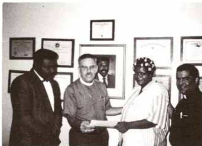
Entrega de una ayuda del Fondo de Ayuda Mundial del Obispo Primado a la Comunidad Nuevo Amanecer, antes Villa Colobo