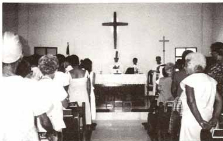
Oficio para la bendición de las obras de expansión y remodelación de la Iglesia San Pablo en la ciudad de Cienfuegos, Cuba