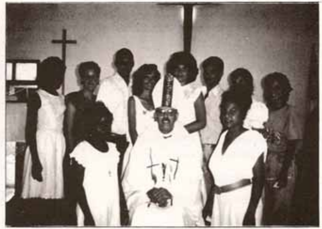
Visita Pastoral a la feligresía San Pablo en la Ciudad de Cienfuegos, Cuba