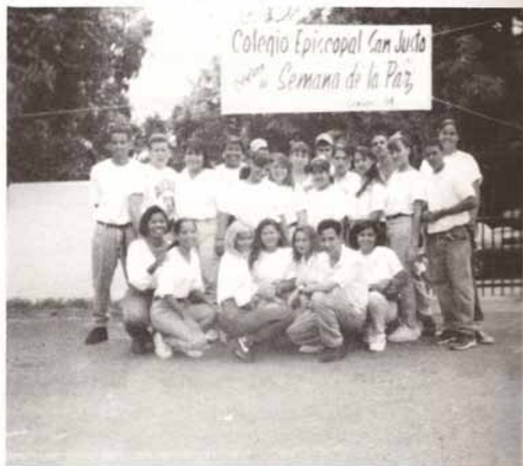
Organizadores de la Semana de la Paz Clase Graduada de 1994