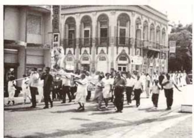
Instalación del Santo San Rafael Arcángel