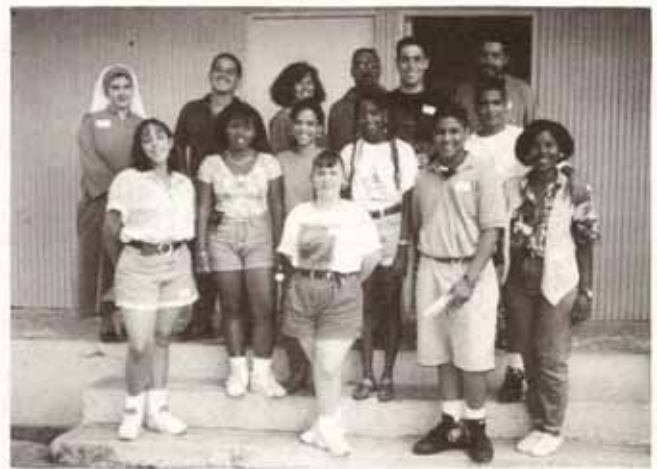
Jóvenes participantes de la Selección de Intercambio 1994.