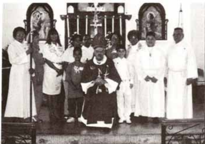
Visita Pastoral Iglesia Santa María Virgen