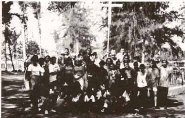
Campamento de Verano de 1994