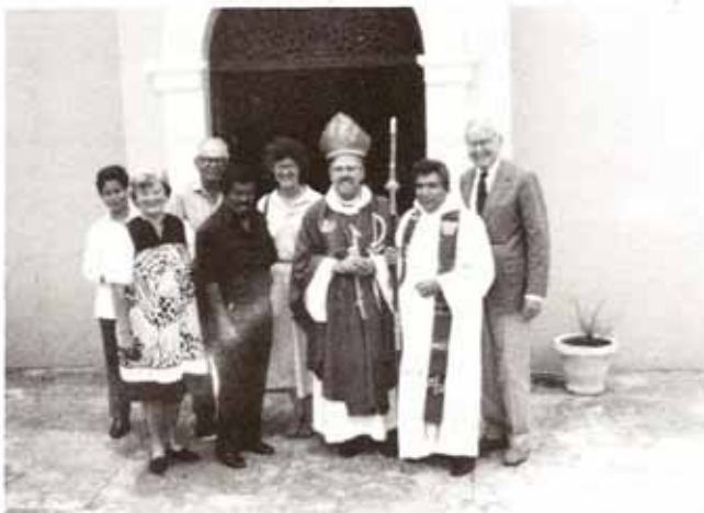
Visita de la delegación de la Diócesis Compañera de Missouri a San Marcos