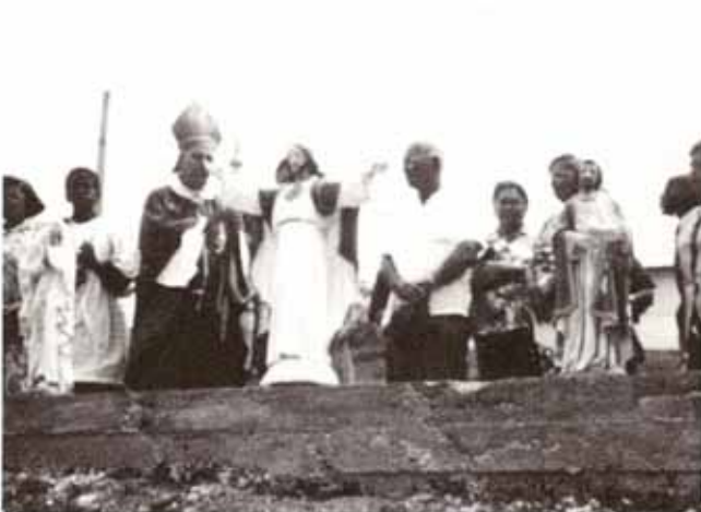
Bendición Santo Patrón San Rafael Arcángel