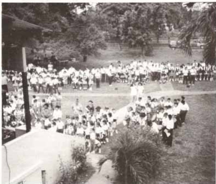
Vista parcial de los estudiantes participantes de la semana de la paz, mayo 1994