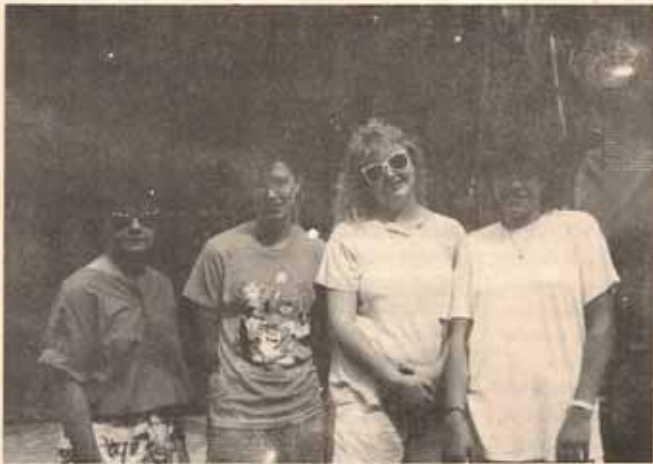
Jóvenes de la Diócesis de Belén, E.U. que estuvieron en Puerto Rico, durante el intercambio el verano pasado.