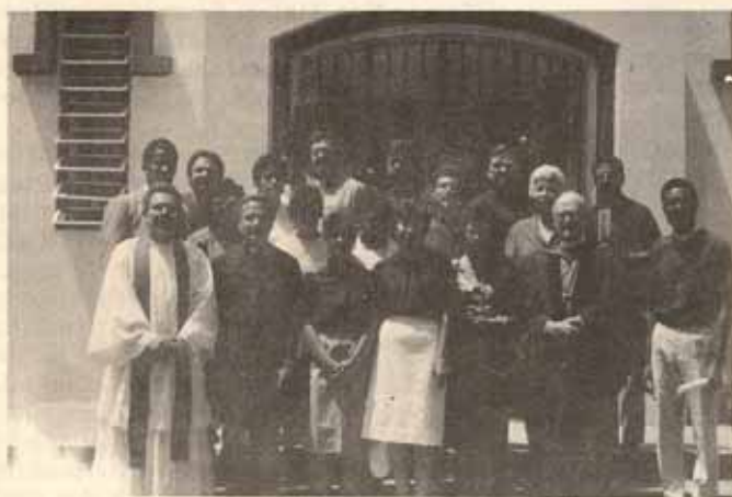
Clausura del Programa ESTUDIO y clausura del Programa Clínico pastoral en Puerto Rico.