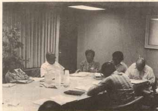
Reunión del Area del Caribe celebrada en Miami, con la presencia de Cuba, Haití, República Dominicana, Puerto Rico e Islas Vírgenes.