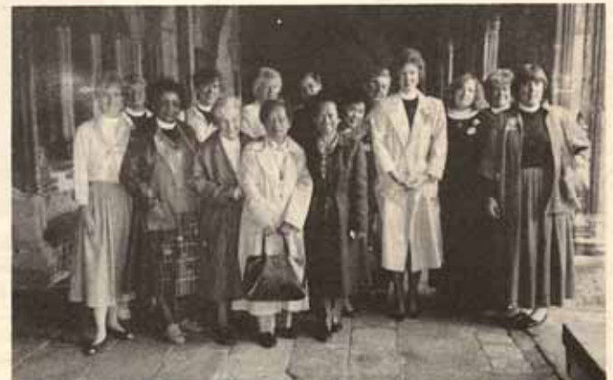
En la Catedral de Canterbury, grupo de mujeres invitadas por el Episcopal Women Caucus.

eligió mi persona sin nunca haberme conocido. Estuve con su familia disfrutando del desayuno y el almuerzo en su casa parroquial. También compartí con la feligresía en la hora del café o té en su salón parroquial. Conocí a varias personas que habían visitado a mi isla. Fue una gran experiencia para mí. Ya en el 1986 cuando asistí a otro evento mundial anglicano en la Catedral de Canterbury visité Lancaster donde prediqué en dos iglesias: The Priory of St. Mary y otra que no recuerdo su nombre y allí tengo dos grandes amigas, con quienes compartí por teléfono esta vez. Ambas nos escribimos varias veces al año.