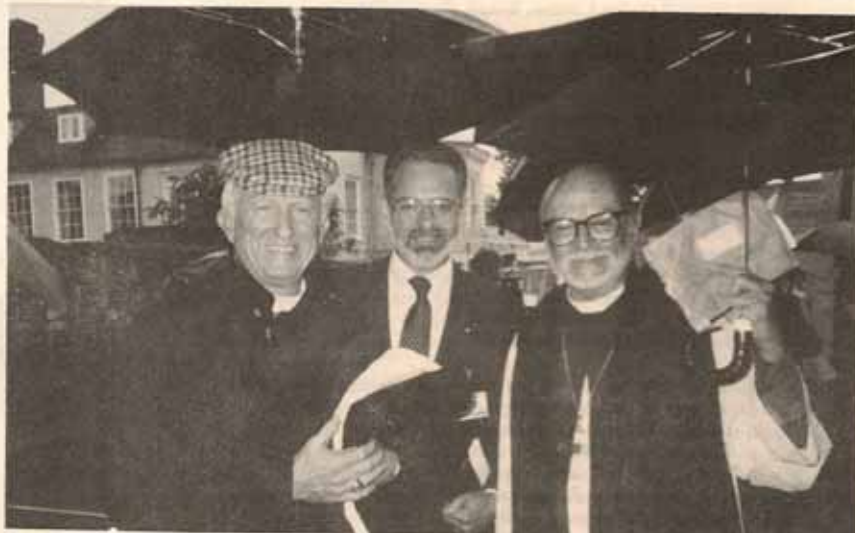
El Primado Edmond E. Browning, Obispo Reus y el Padre Charles Cessanetti, protegiéndose de la lluvia, durante el oficio de apertura de la Conferencia de Lambeth, Inglaterra.

• Nuestro diocesano regresó sano y salvo de sus vacaciones, las cuales fueron combinadas con actividades relacionadas con su oficio episcopal. En efecto, el Obispo Reus asistió a la Conferencia de Lambeth, celebrada en Londres, del 16 de julio al 7 de agosto. La Conferencia de Lambeth es la más importante reunión de la Comunión Anglicana, donde unos 500 obispos se dan cita para reflexionar sobre asuntos que atañen a los miembros de la grande familia anglicana, la cual cuenta con más de 70 millones a través del mundo.