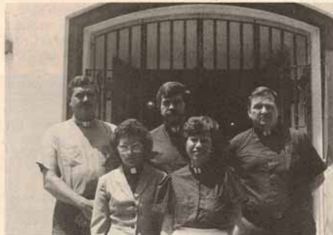
Participantes de Puerto Rico en el adiestramiento clínico pastoral celebrado en el mes de junio, 1988.