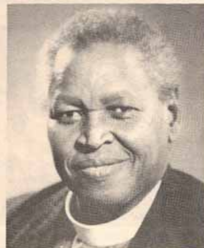
Monseñor Manasses Kuria, Arzobispo anglicano de Kenya.

Uno de los problemas principales es el Ecumenismo. En Kenya hay un sinnúmero de denominaciones y no hay buena comunicación entre ellas. Es el deseo de nuestra iglesia el iniciar conversaciones de unidad hasta llegar a unas relaciones maduras, en especial con la Iglesia Católica Romana.