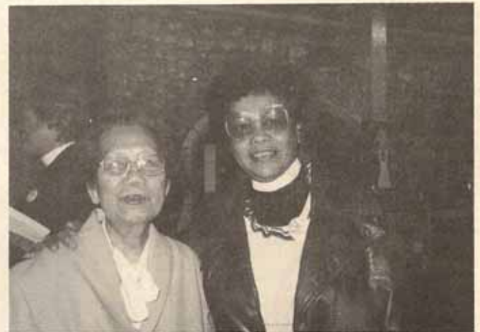
Rev. Li Tim Oi primera mujer ordenada en China por Obispo Hall inglés en el 1944.

Tuve la oportunidad de recibir una invitación del Vicario de la Iglesia Saint Peter en Canterbury para el domingo que se inauguró la Conferencia de Lambeth. Prediqué sobre los propios del día, ayude al vicario en el altar en la distribución de la comunión a su feligresía. De las que se le proyectó él