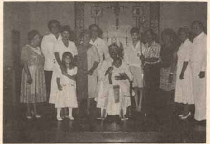
Visita pastoral a la feligresía de habla hispana de la Catedral Episcopal en San Juan, Puerto Rico.