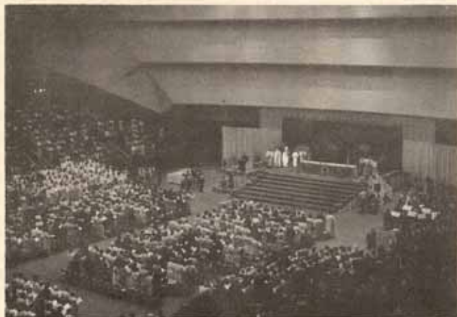
Vista general de la Eucaristía celebrada en la Convención General en Detroit.