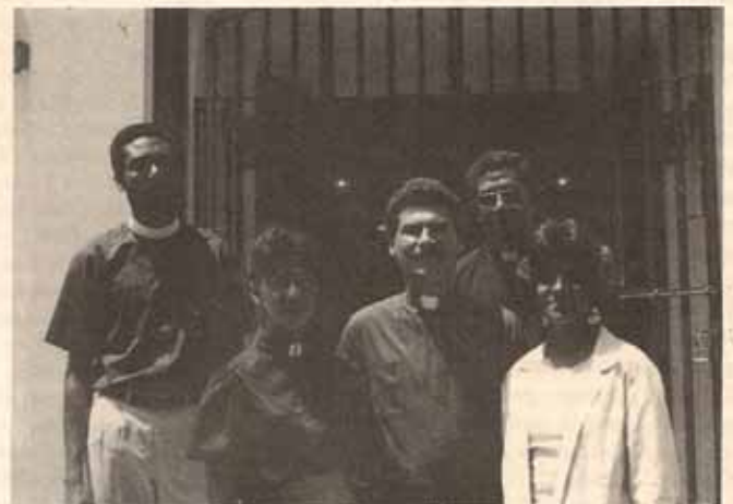
Participantes de Haití y de la República Dominicana en el adiestramiento clínico pastoral en Puerto Rico.