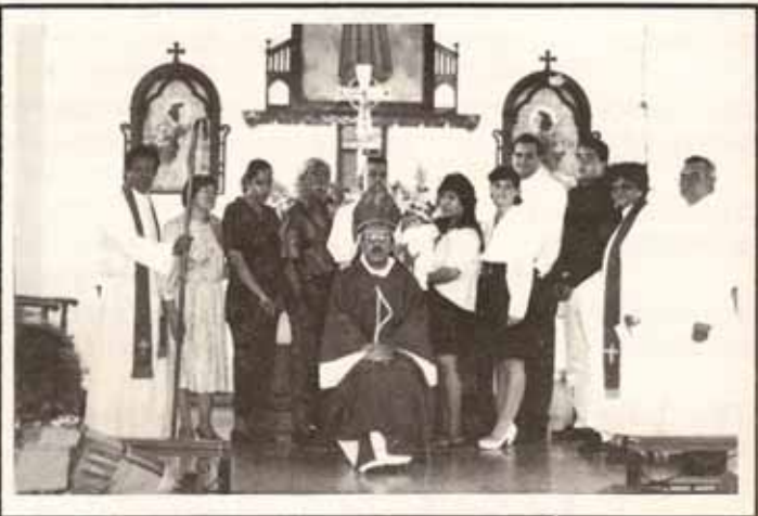
Bautismo y reafirmación de fe durante Visita Pastoral a iglesia Santa María Virgen, Ponce