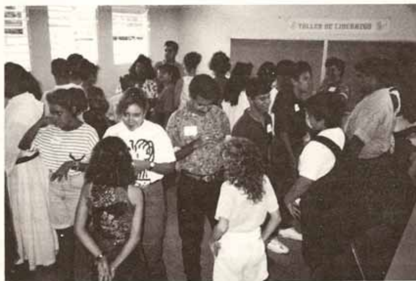
Taller de Liderazgo en los Arcedianatos Nor-Oeste y Centro-Oeste