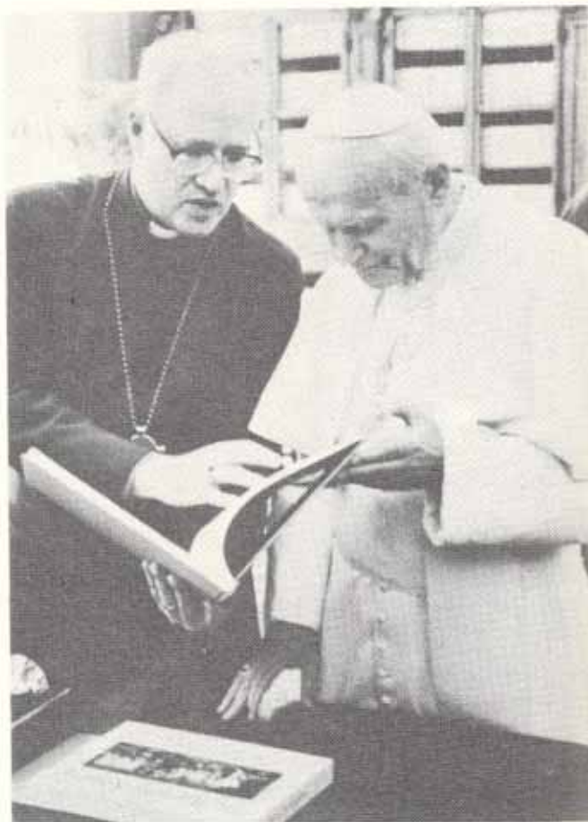
El Arzobispo de Cantórbery y el Papa Juan Pablo II intercambian regalos durante la reciente visita de Carey al Vaticano.

Carey había criticado públicamente la respuesta del Vaticano como «desalentadora» y dijo que el requisito implícito de que las partes en el diálogo deben atenerse a formulaciones teológi-