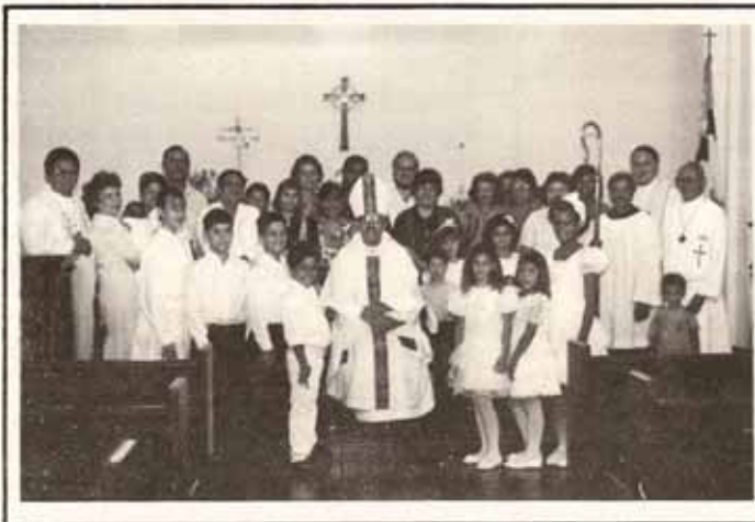
Bautismos, Confirmaciones y Recepciones durante Visita Pastoral a la Parroquia Santísima Trinidad, Ponce