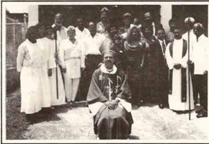
Bautismos, Confirmaciones y Recepciones durante Visita Pastoral a la iglesia Stgo. Apóstol, Río Grande