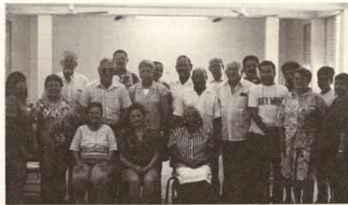
Participantes del Taller de Ministerios Laicos el pasado 15 de agosto, en San Justo.