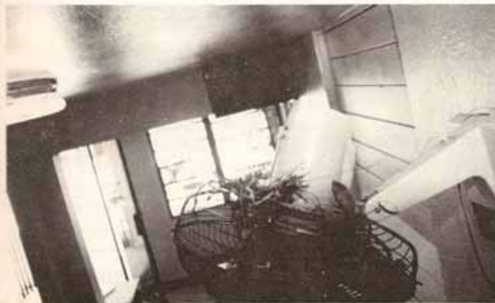
¡Parece abanico roto! ¡NO! Es un nido de una ave en la iglesia, cuyo nombre nos recuerda a aquel que amaba los animales, San Francisco de Asís.