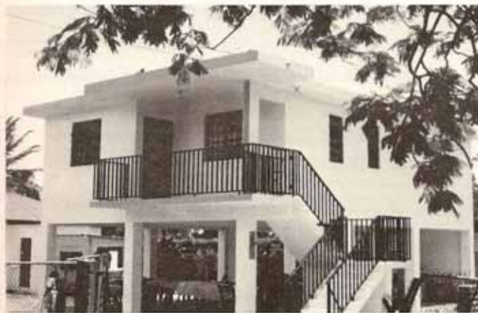
Vista de la nueva Casa Parroquial y futuro salón parroquial (bajos) de la igl. Sta. Cecilia, Ensenada