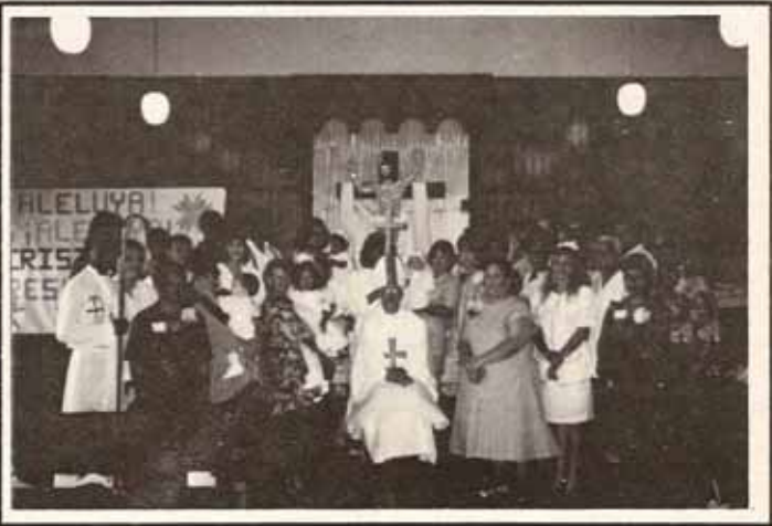
Bautismos, Confirmaciones y Recepciones durante Visita Pastoral a la iglesia El Buen Pastor, Fajardo