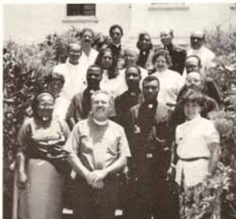
Estos fueron los participantes de Cuba, Haití, Connecticut, República Dominicana, Ecuador y Puerto Rico en el Programa Clínico Pastoral que se celebró en el Hospital Episcopal San Lucas en Ponce.