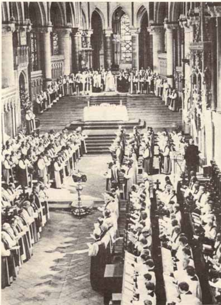
Oficio de Apertura de la XI Conferencia de Lambeth Véase información en pág. 3