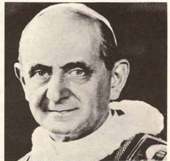
Su Santidad Paulo VI Información en pág. 4