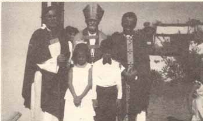
Visita Pastoral del Obispo a la Iglesia San José, Bo. Caimito de Río Piedras