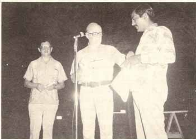
Entrega de Reconocimiento al Guardián Mayor de la Iglesia San Pablo