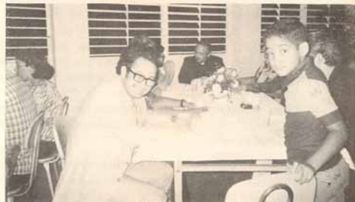
Concurrentes a la Cena de Confraternización de la Asamblea disfrutaron de la camaradería y del .....

Durante los días del 20 al 21 de mayo de este año, la Iglesia Episcopal de Puerto Rico celebró la 71ra. Asamblea Diocesana de Conferencias San Justo en el Centro Cultural de Trujillo Alto.