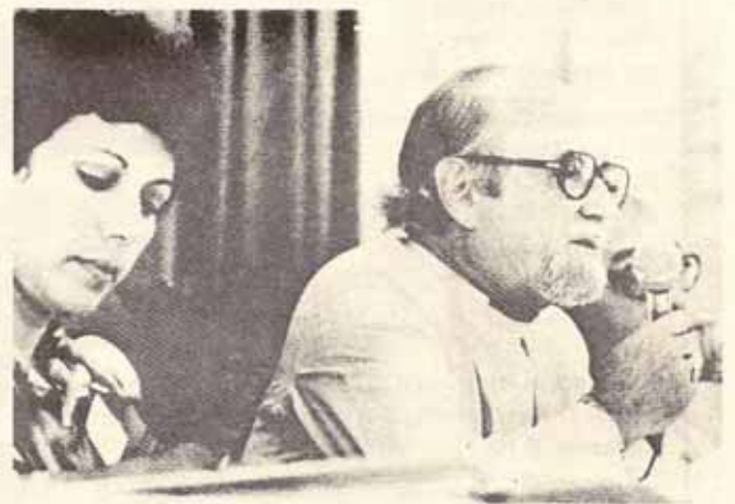
Información sobre la 71ra. Asamblea Diocesana. Vea págs. 6 y 7