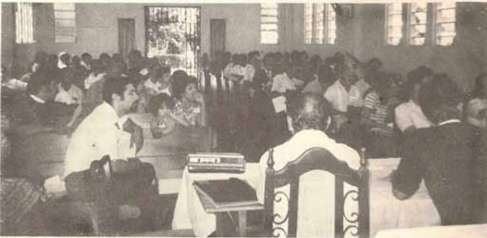
Vista de los Delegados en sesión.