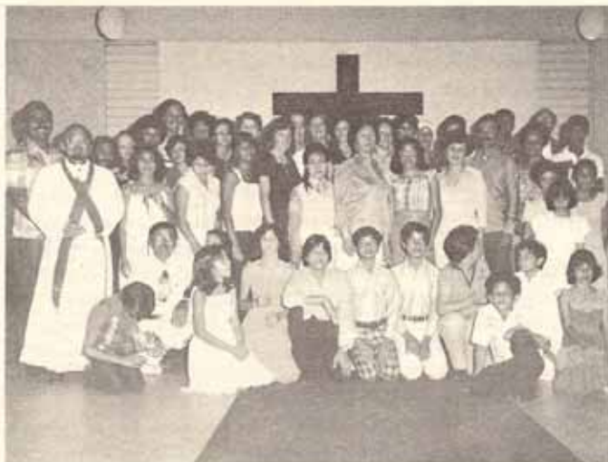
Grupo de Confirmación y Recepción en Visita Pastoral del Obispo a la Iglesia San Pablo en Arecibo