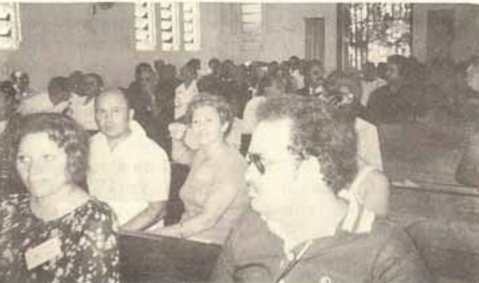
Vista parcial de los Delegados durante una de las Sesiones de la Asamblea.