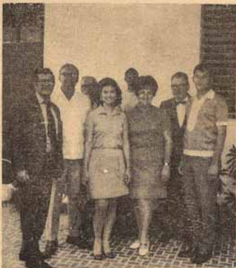
Miembros Junta Parroquial 1970.