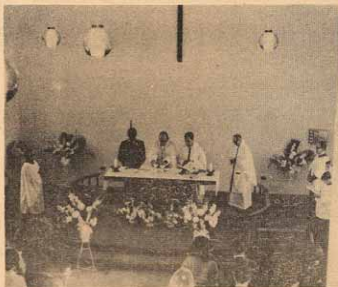
Nueva fachada - Enero 1968.

Y como en el año 1938 nosotros nos encontramos en el amanecer de un nuevo día. Pero más aún, nosotros nos encontramos en la encrucijada de una vida y en el comienzo de una nueva era. También tenemos ahora mismo ante nosotros un libro con páginas diáfnas y claras como el cristal; ahora lo que se escriba en esas páginas dependerá de cada uno de nosotros. Oro a Dios para que El nos ilumine y nos ayude para lo que que escribamos en las páginas de nuestro libro sean huellas de nuestro amor y compromiso para El y para con nuestro p.ójimo.