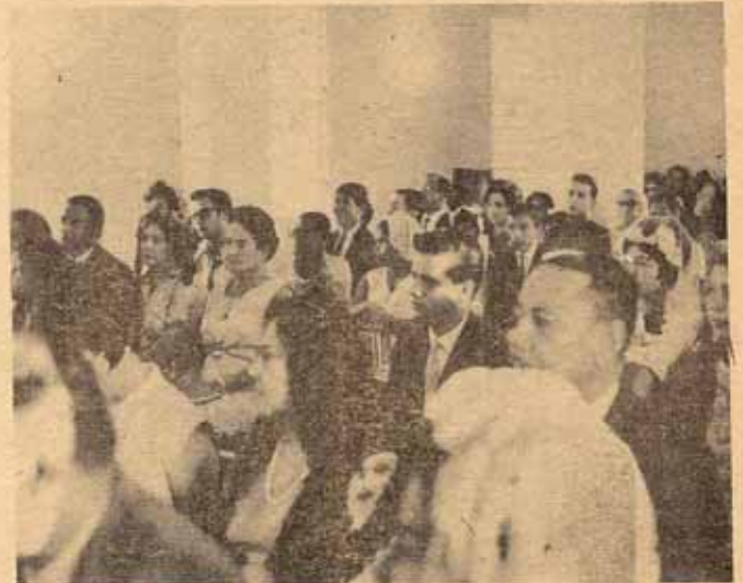
Vista parcial de fieles.

Por años, sin embargo, según el trabajo maduraba cada vez que surgía una crisis, mirábamos hacia el Norte para nuestro sustento. Por ejemplo, de Estados Unidos llegaba ropa la cual se vendía a precios módicos y cuya ganancia se usaba en el manejo de la iglesia. El dinero usado para la construcción del templo original en el año 1940 fué un regalo de $6.500 enviados de Estados Unidos. Los gastos para la construcción del salón parroquial fué un regalo de la iglesia de Estados Unidos por la cantidad de $12,000 y todos los servicios del Padre Fogg los costaba el Concilio Nacional de Estados Unidos.