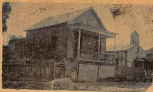
Primitiva Iglesia y Rectoría.