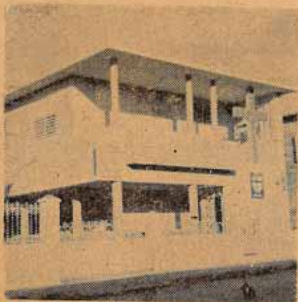
Fachada de la actual Rectoría y Escuela de Santa María Virgen.

Esta Misión tiene planes para otros importantes proyectos. A la congregación no le faltan deseos de gente rica, aunque tienen bolsillos de gente pobre... , pero, esperemos, oremos y trabajemos.