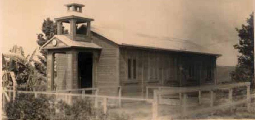
VISTA EXTERIOR DE LA MISIÓN "SAN BARTOLOME"