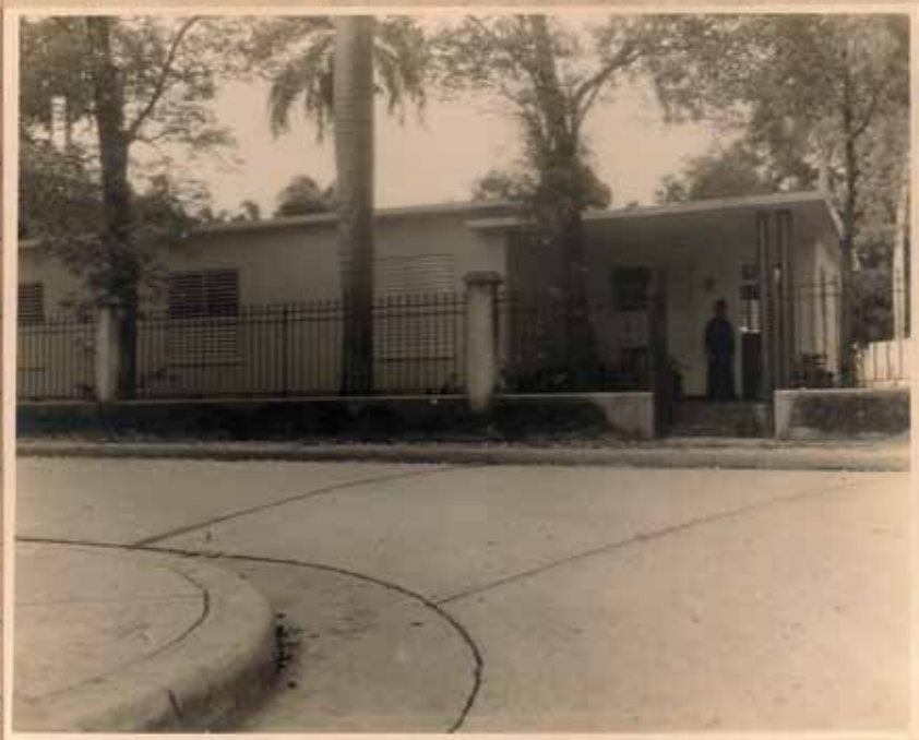
FRENTE (SUR) DE LA NUEVA RECTORIA DE LA STMA TRINIDAD