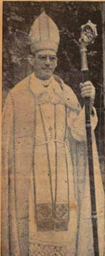
SR. OBISPO CHARLES F. BOYNTON

En su Obispado se adquirió la magnífica propiedad en el Bo. St. Just., con el propósito de establecer, el Colegio San Justo. Allí se ha construido también la magnífica iglesia "La Sagrada Familia" y otras obras importantes; en su Obispado se construyó la capilla de concreto armado, "La Santa Cruz" en el Bo. Castañer; en el Bo. Bartolo, la vieja capilla fué reemplazada por una nueva y más atractiva; en Ensenada se ha construido la capilla de estilo colonial; en Yauco la bella iglesia y elegante rectoría; en Ponce, en la Santísima Trinidad, el grandioso salón parroquial y también otra moderna rectoría, y en San Juan la nueva ala que actualmente está construyéndose en la Catedral... El Sr. Obispo Boynton se mostró siempre muy paternalmente solícito por mejorar el proble-