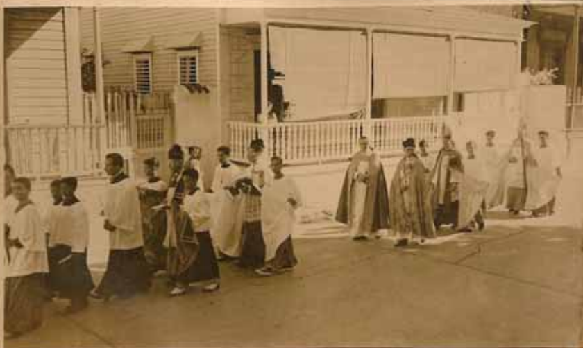
TERMINAL DE LA PROCESIÓN