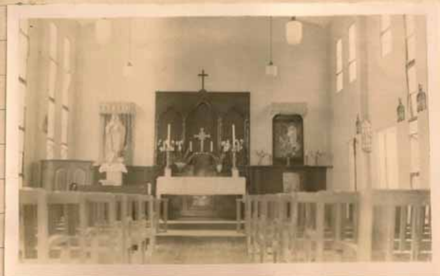
INTERIOR DE LA IGLESIA DE YAUCO. EL ALTAR