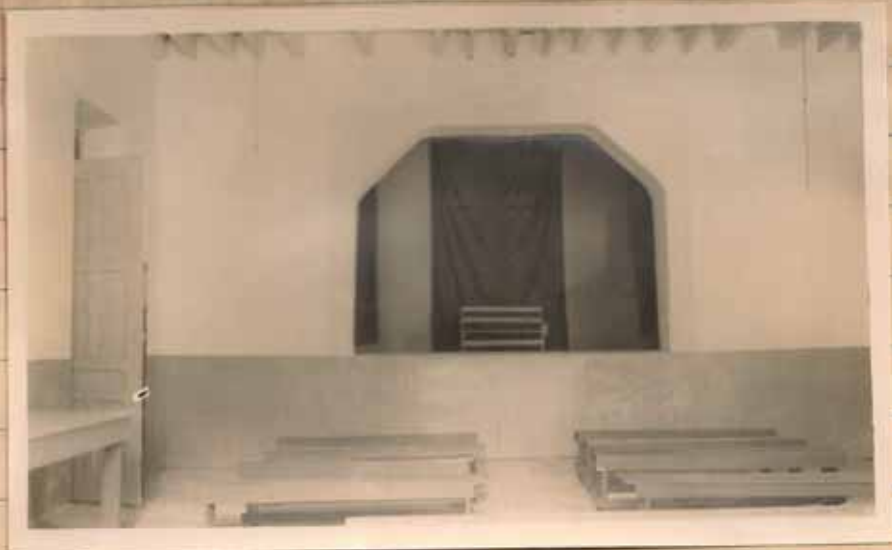
SALON-ESCENARIO DE QUEBRADA LIMÓN