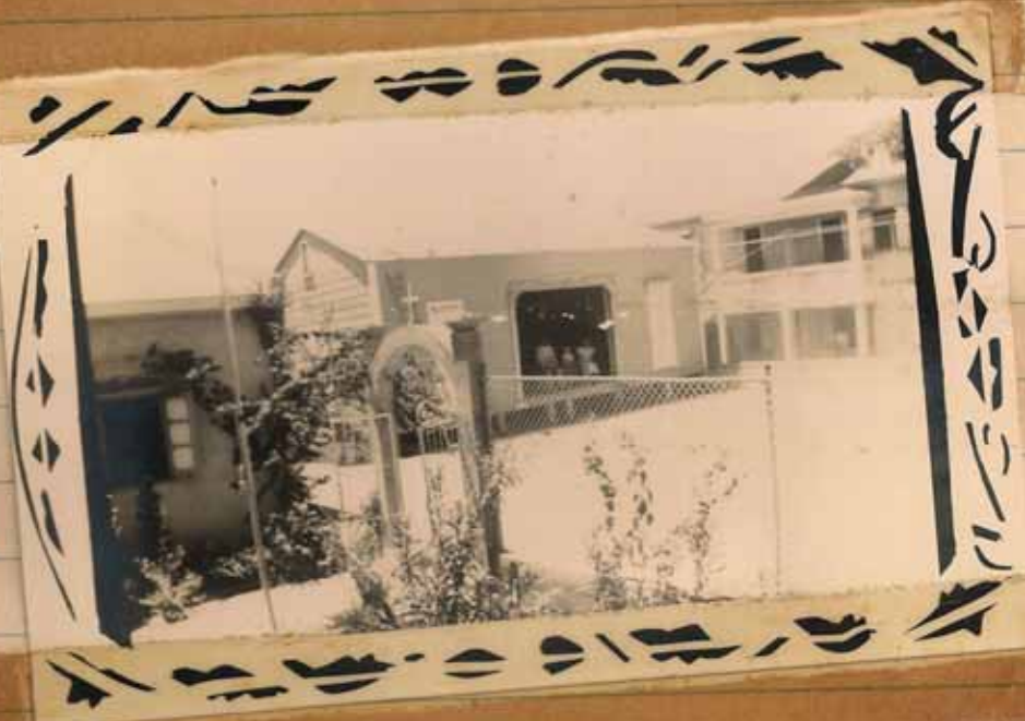
SALÓN - ESCUELA - ESCENARIO DE S. M. V.

LA MISIÓN "SANTA MARIA VIRGEN", PONCE, DE MAR- ZO A OCTUBRE, EN QUE EMPEZARON LOS JUEGOS DE PELOTA, TUVO UN PROGRAMA RADIAL SEMANAL, POR LA W. P. R. P. DE PONCE.