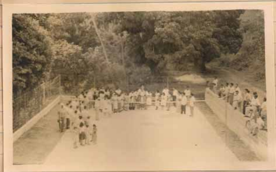
ACTO DE LA BENDICIÓN DE LA CANCHA DE QUEBRADA LIMÓN