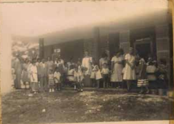
ACTO DESPUES DE LA BENDICION