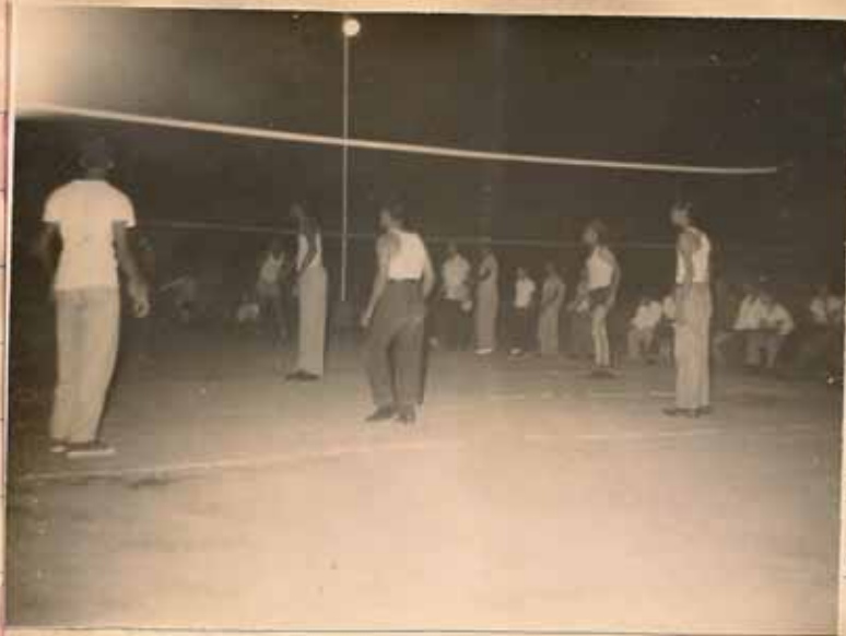
← PRIMER JUEGO EN LA NUEVA CANCHA DE SAN MARCOS, MAGUE- YES, ENTRE LOS JO- VENES DE S. MARCOS Y LA STMA TRINIDAD DE PONCE. GANO SAN MARCOS.