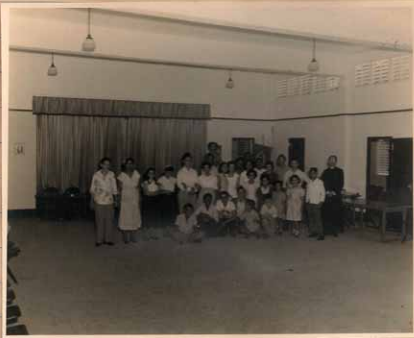
INTERIOR DEL SALÓN - ESCENARIO DE LA STMA TRINIDAD.