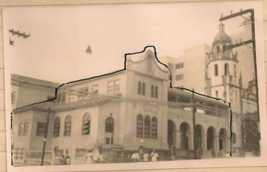
LA NUEVA ALA "BISPO COLMORE" Y ELEGANTE GALERIA EN LA CATEDRAL DE SANTURCE.