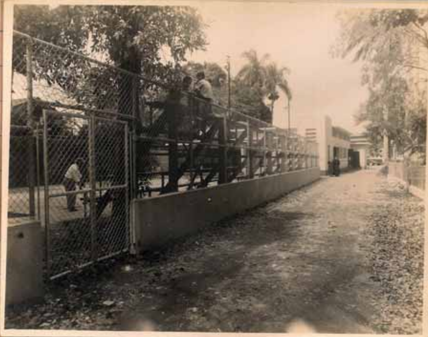
LADO SUR DEL SALÓN Y MANCHA DE LA STMA TRINIDAD.