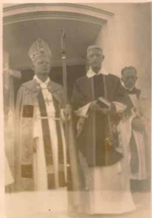
Bp. SWIFT - DR. BECKWITH

PARA INFORMACION MAS DETALLADA SE PUEDE HALLAR EN LAS CARTAS MENSUA- LES DE NUESTRO SEÑOR OBISPO AL CLERO