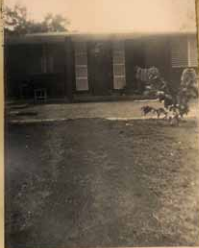
LA NUEVA RECTORIA EN HATO REY, P.R.