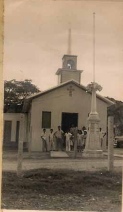
MISION "SANTA CECILIA" (VISTA DE FRENTE)