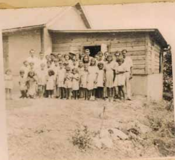
SALONCITO PARROQUIAL DE LA MISION "SANTA HILDA"