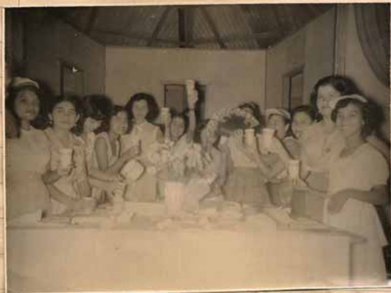
LA CONCLURENCIA FUE OBSEQUIADA CON MUCHAS CO- SAS RICAS, POR LA DIRECTIVA DE LA MISION