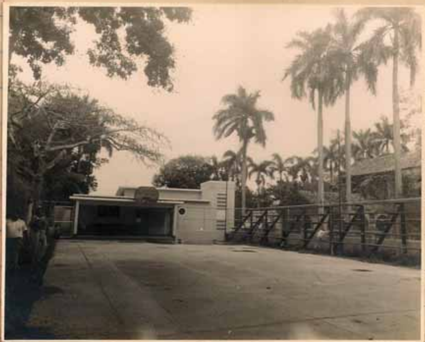
CANCHA, FRENTE (ESTE) DEL SALÓN Y GRADAS DE LA STMA TRINIDAD