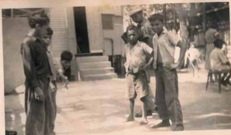
UN GRUPO DE NIÑOS JUGAN- DO EN LA CANCHA.

The House has been open each morning and afternoon from Monday to Friday, (9:00-11:30 -2:00-4:45) and Saturday afternoon. To date 515 boys have registered and at least 150 to 200 more have taken part in its activities for a short time without registering. Of this number approximately \frac{3}{4} are in school. Of the 100 or so boys who come most regularly to the Center, however, only \frac{1}{4} are in school, the remaining \frac{3}{4} being boys who formerly spent their entire day on the street. The large majority of the boys come from very poor homes, and many of them are boys who have been in trouble with the law or come from the families of such boys.