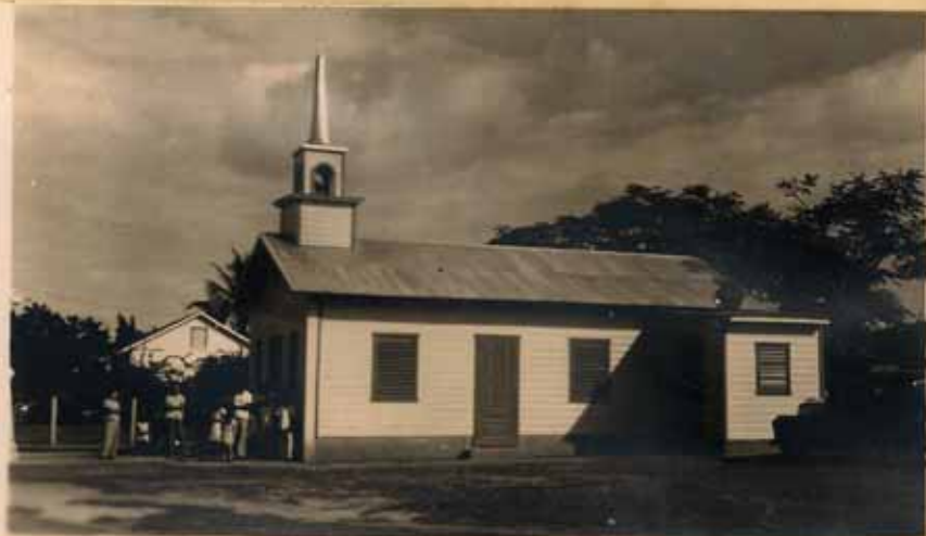
VISTA LATERAL DE LA MISMA