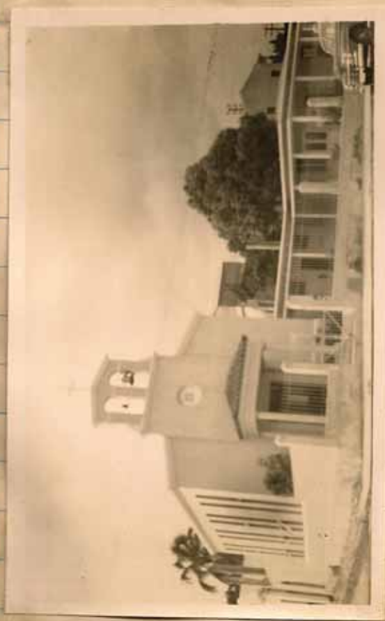
EXTERIOR DE LA IGLESIA Y RECTO- RIA DE LA MISIÓN EN YAUCO.

DE CAOBA ES OBRA DEL PADRE DEL RDO PADRE RUIZ. EL CUADRO DE SAN RAFAEL ARCANGEL, AL OLEO, ES OBRA DE MRS. RICHARDS.