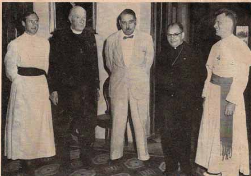
His Grace (second from left), with aide and hosts in Puerto Rico*

Foundation to "make a fresh appeal to the Holy Scriptures"