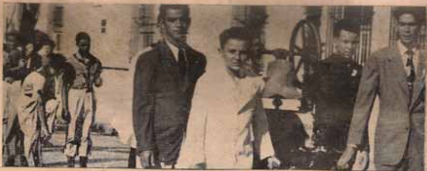
CAMPANA DE LA LIBERTAD RELIGIOSA EN P. R.