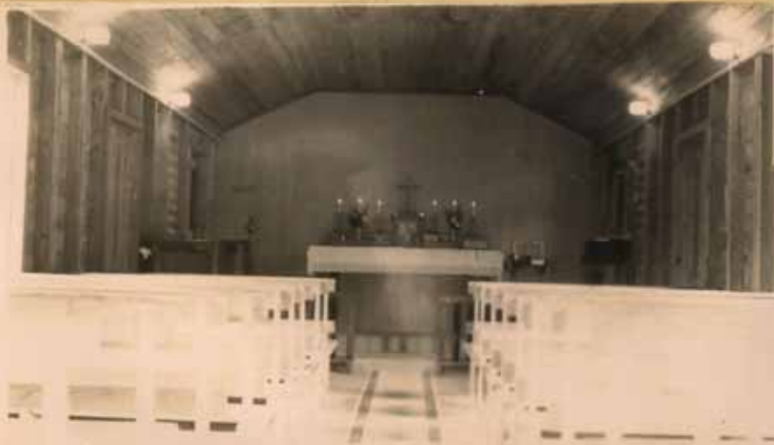
VISTA INTERIOR DE LA MISMA