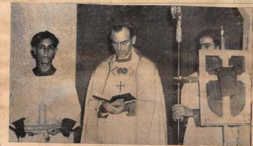
EL SR. OBISPO DIOCESANO CHARLES F. BOYNTON EN ES SERVICIO VESPERTINO QUE SE TUVO PARA FINALIZAR EL CENTENARIO DEL "LIBRO DE ORACION COMUN".